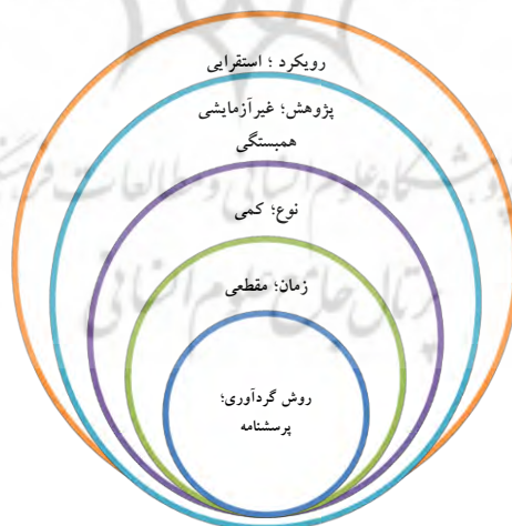
شکل ۱- مدل پیاز پژوهش

پایایی پرسش‌نامه تحقیق با استفاده از شاخص سازگاری درونی (آلفای کرونباخ) مورد بررسی قرار گرفت. میزان آلفای کرونباخ به دست آمده از نرم‌افزار (SPSS) به میزان ۰/۹۵۰ می‌باشد و با توجه به اینکه بالای ۰/۷ است پایایی پرسشنامه مورد قبول واقع می‌شود. لازم به ذکر است در جهت ارزیابی میزان نظرات، از طیف رتبه‌ای لیکرت استفاده شده و برای تجزیه و تحلیل داده‌ها از روش تی تک نمونه‌ای به وسیله نرم‌افزار SPSSwin22 استفاده شده است.