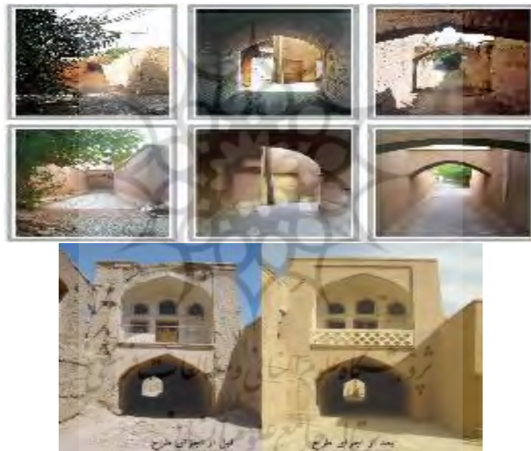
شکل ۳- وضعیت تأثیر پروژه بهسازی بافت با ارزش روی ساماندهی و روان‌سازی عناصر ارتباط‌دهنده و دسترسی‌های محله‌ای

❖ ساماندهی و هویت بخشی به هسته کهن و واجد ارزش روستا: همان‌گونه که در جدول ۱۱، مشاهده می‌شود میزان فراوانی زیاد با ۴۲ مورد بیشترین و آمار کم با ۳ مورد کمترین مقدار را از دیدگاه حجم نمونه‌ها به خود اختصاص داده‌اند. میانگین مؤلفه