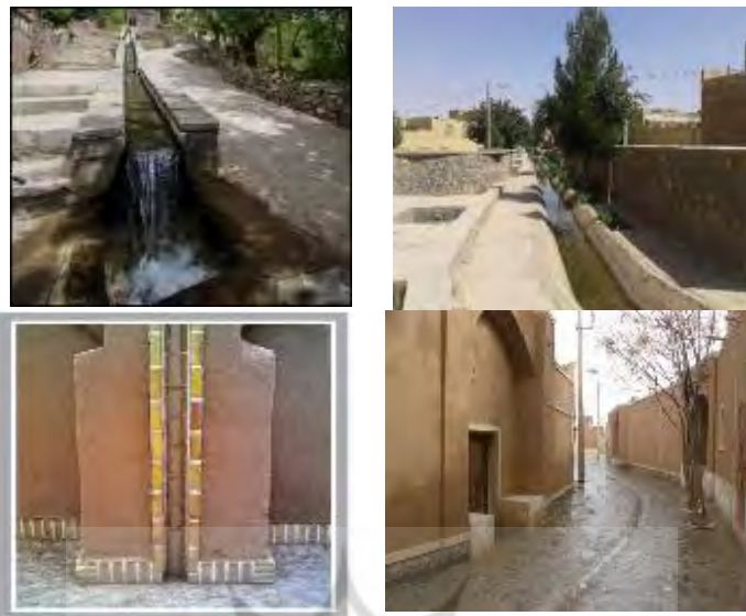
شکل ۵- وضعیت تأثیر پروژه بهسازی بافت باارزش روی ایجاد و تجهیز تأسیسات و کانال‌های هدایت و جمع‌آوری آب‌های سطحی

❖ کیفیت جداره‌ها و کف (رنگ، بافت، ترکیب و نوع مصالح): همان‌گونه که در جدول ۱۳، مشاهده می‌شود میزان فراوانی خیلی زیاد با ۴۵ مورد بیشترین و آمار خیلی کم با ۱ مورد کمترین مقدار را از دیدگاه حجم نمونه‌ها به خود اختصاص داده‌اند. میانگین مؤلفه ساخت و تجهیز شبکه دفع بهداشتی پساب‌ها و فاضلاب‌های خانگی در محیط روستا در گروه نمونه برابر با 3/586 می‌باشد که از مقدار نمره معیار (۳) بالاتر بوده است. در نتیجه سطح خطای آلفای مؤلفه (sig)، از ۵ درصد کوچک‌تر می‌باشد بنابراین پروژه‌های عمرانی بنیاد مسکن انقلاب اسلامی تا سطح معناداری ۹۵ درصد روی مؤلفه مذکور تأثیرگذار بوده است. یافته‌های محیطی در سطح برخی از روستاهای استان یزد طبق شکل ۶، نشان می‌دهد که در پروژه‌های بهسازی بافت باارزش، با انجام مداخلات چه در کف‌سازی و چه بدنه‌سازی ضمن ایجاد هارمونی و هماهنگی با بافت، توانسته کیفیت جداره‌ها و کف را از لحاظ رنگ، بافت، ترکیب و نوع مصالح را احیا کند.