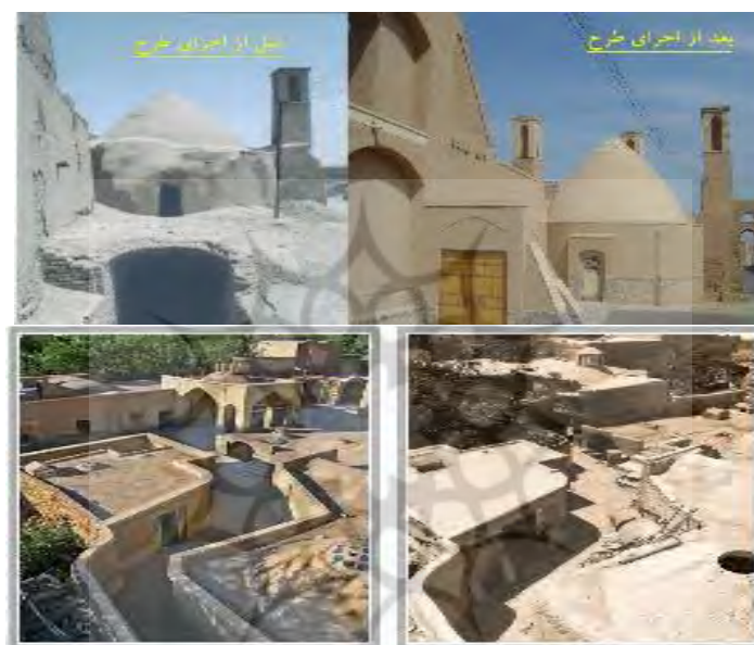
شکل ۴- وضعیت تأثیر پروژه بهسازی بافت باارزش روی ساماندهی و هویت بخشی به هسته کهن و واجد ارزش روستا

برخی از روستاهای استان یزد طبق شکل ۵، نشان می‌دهد که در پروژه‌های بهسازی بافت باارزش، هدایت و جمع‌آوری آب‌های سطحی، پساب‌ها و فاضلاب‌های در بافت روستا مورد بهبود قرار گرفته است زیرا این فضاها با ایجاد ساخت و تجهیز شبکه و جدول‌کشی و الحاق کانیه‌های مناسب با جهت و شیب مطلوب، به منظر روستا بسیار کمک کرده است.