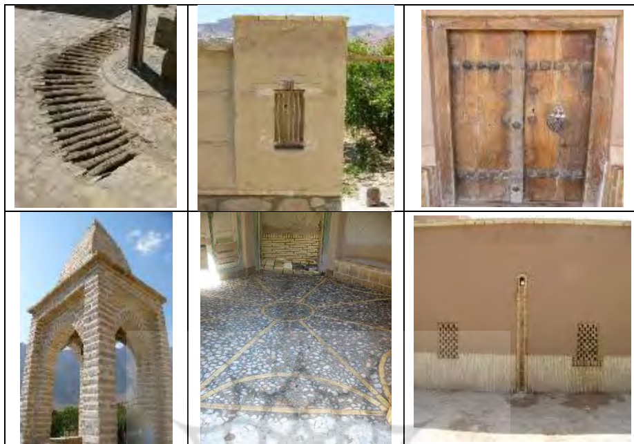
شکل ۷- وضعیت تأثیر پروژه بهسازی بافت باارزش روی استفاده از مصالح بوم آورد منطقه در بهسازی و ارائه الگوهای بومی

❖ استفاده بهینه از کاربری‌های متروکه و تبدیل آن‌ها به کاربری هم‌سنخ فعال: همان‌گونه که در جدول ۱۵، مشاهده می‌شود میزان فراوانی زیاد با ۲۹ مورد بیشترین و آمار خیلی کم با ۳ مورد کمترین مقدار را از دیدگاه حجم نمونه‌ها به خود اختصاص داده‌اند. میانگین مؤلفه در گروه نمونه برابر با 3/173 می‌باشد که از مقدار نمره معیار (۳) بالاتر بوده است. در نتیجه سطح خطای آلفای مؤلفه (sig)، از ۵ درصد کوچک‌تر می‌باشد بنابراین پروژه‌های عمرانی بنیاد مسکن انقلاب اسلامی تا سطح معناداری ۹۹ درصد روی مؤلفه مذکور تأثیرگذار بوده است. یافته‌های محیطی در سطح روستاهای استان یزد طبق شکل ۸، نشان می‌دهد که پروژه‌های بهسازی بافت باارزش، باعث رونق و احیای مجدد حفظ ساختمان‌های تاریخی و بهره‌برداری مجدد انطباقی و همچنین برقراری تعادل فضایی و عملکردی در این ساختمان‌ها شده است ضمن اینکه تمامی جزئیات این طرح‌ها