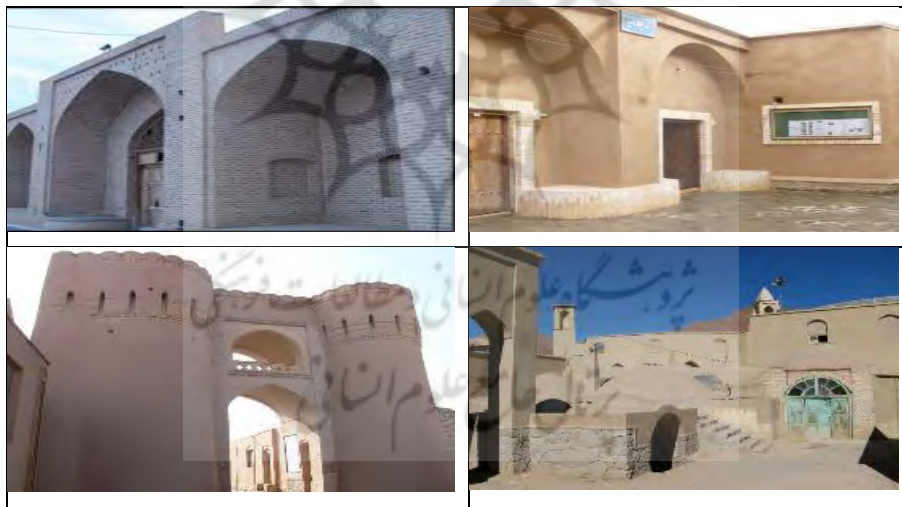
شکل ۸- وضعیت تأثیر پروژه بهسازی بافت باارزش روی استفاده بهینه از کاربری‌های متروکه و تبدیل آن‌ها به کاربری هم‌سنخ فعال