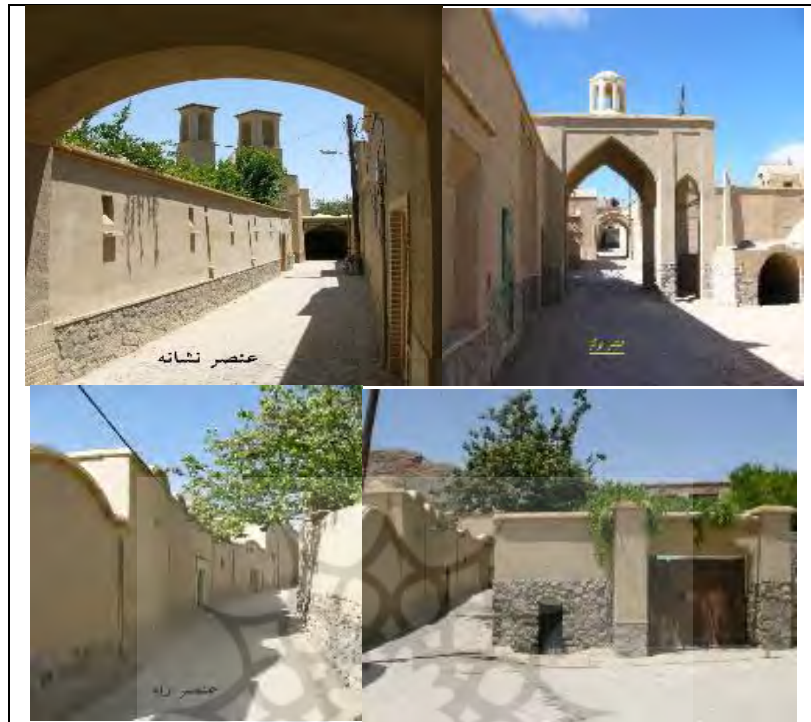
شکل ۲- شناسایی عناصر کالبدی درون بافت (گره، لبه، نشانه، مرکز و راه) و احیا، مرمت و جلوه بخشی به آنها

❖ ارتقای شاخص‌های مدیریت بحران در اجرای الگوهای بهسازی: همان‌گونه که در جدول ۹، مشاهده می‌شود میزان فراوانی زیاد با ۲۹ مورد بیشترین و آمار خیلی کم با ۸ مورد کمترین مقدار را از دیدگاه حجم نمونه‌ها به خود اختصاص داده‌اند. میانگین مؤلفه ارتقای شاخص‌های مدیریت بحران در طراحی الگوهای توسعه بافت کالبدی روستاها در گروه نمونه برابر با 3/186 می‌باشد که از مقدار نمره معیار (۳) بالاتر بوده است. در نتیجه سطح خطای آلفای مؤلفه (sig)، از ۵ درصد کوچک‌تر هست بنابراین پروژه‌های عمرانی بنیاد مسکن انقلاب اسلامی تا سطح معناداری ۹۵ درصد روی مؤلفه مذکور تأثیرگذار بوده است. یافته‌های محیطی در سطح برخی از روستاهای استان یزد طبق شکل ۳، نشان می‌دهد که در پروژه‌های بهسازی بافت با ارزش در هنگام طراحی الگوهای