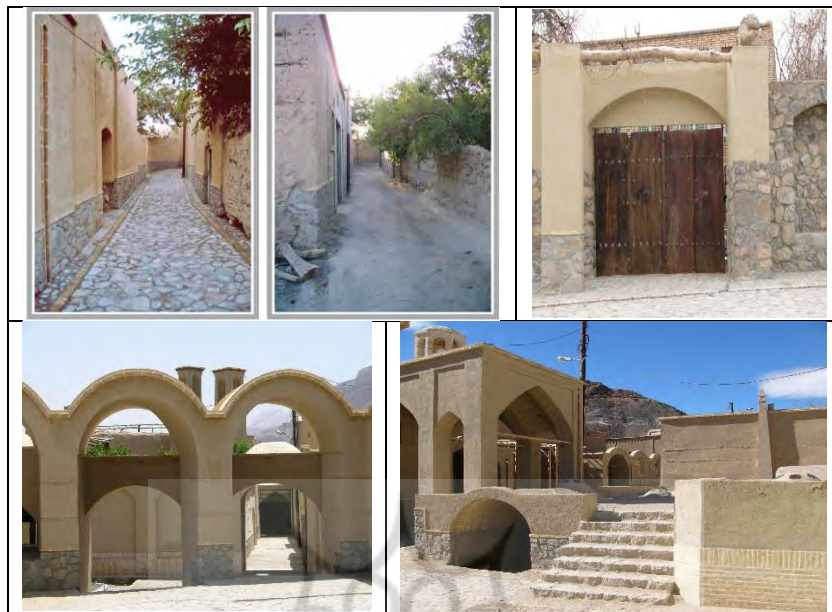
شکل ۹- وضعیت تأثیر پروژه بهسازی بافت باارزش روی خلق فضاهای متنوع در بافت و معابر درون روستایی