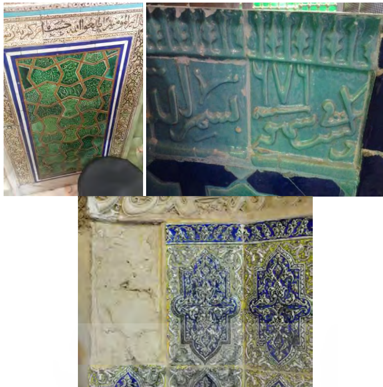
تصویر ۱- امامزاده سید اسحاق ساوه (مأخذ: نگارنده). تصویر ۲. اتاق مقبره امام رضا (ع) (مأخذ: نگارنده). تصویر ۳. امامزاده یحیی ورامین (مأخذ: نگارنده).