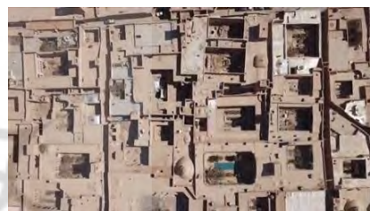
تصویر ۷- گونه بندی خانه‌های یک حیاطه و چند حیاطه، (ماخذ: سرایی، ۱۳۹۱: ۲۹)