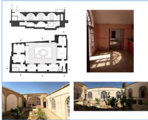
تصویر ۸ - نمونه‌ای از خانه یک حیاطه: خانه کازرونی در محله گلچینان، (ماخذ: نگارنده).