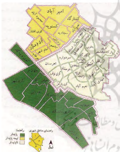
تصویر ۲- کلیت مناطق سه گانه شهر یزد، (ماخذ: پیرنیا و احمدی، ۱۳۹۳: ۱۰).

کاربری‌های مختلف از جمله مسکونی با ۶۶ درصد فراوانی از کل کاربری‌ها طبق آمار سال ۱۳۷۵ است و به مرور، جمعیت زیادی از بافت مهاجرت نموده‌اند (کلانتری و پوراحمد، ۱۳۸۴: ۸۵-۸۴). از آنجا که تعداد قابل توجهی از خانه‌های مسکونی بافت یزد به ثبت آثار رسیده‌اند و از سوی دیگر، سیاست‌های بالادست مبنی بر حفظ خانه‌های بافت قدیم بوده است، در واقع عدد ۶۶ درصد در طول زمان به عنوان یک قابلیت تقریباً ثابت، حفظ شده است اگر چه ساکنان بافت به مرور کم شده‌اند.