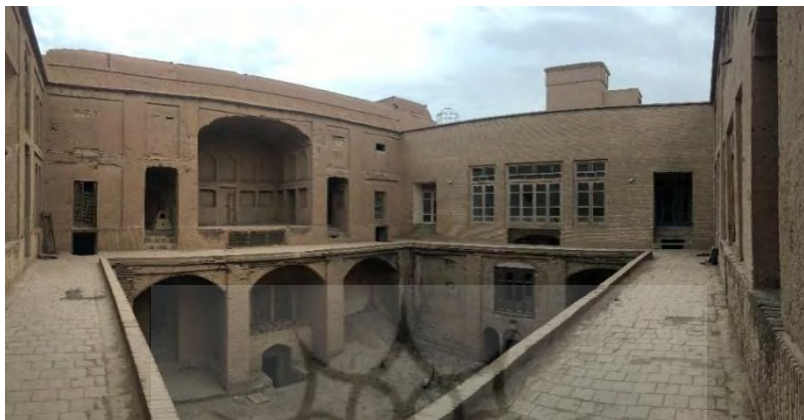
تصویر ۴- بخش سمت راست تصویر که تغییر یافته به دوران پهلوی در خانه استوار است و به نظر می‌رسد به دوران زند و قاجار بازگردد، (ماخذ: نگارنده).

گذرهای بافت و همچنین در مجموعه فضاهای خانه‌ها به خصوص فضاهای بهداشتی و خدماتی روی می‌داد و خانه‌ها به‌روز می‌شدند. چنین فرهنگی تا حدود ۵۰ سال پیش پابرجا بود و ساکنان بافت، سعی می‌کردند با تغییر نیازها و روح زمانه،