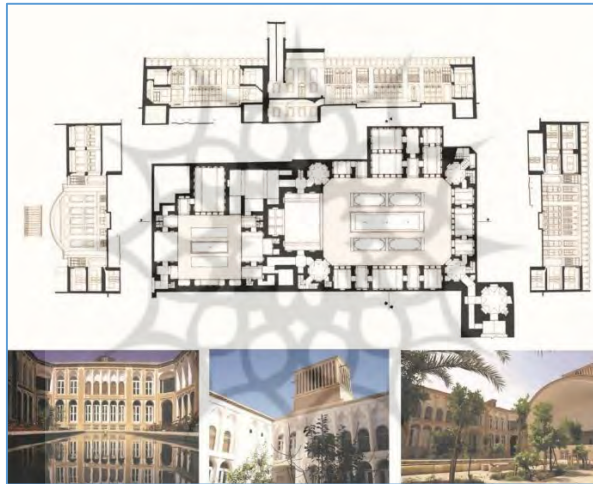
تصویر ۹ - نمونه‌ای از خانه‌های چند حیاطه: خانه مرتاض در محله گلچینان یزد، (ماخذ: حاجی قاسمی، ۱۳۸۳: ۱۸۶-۱۷۸).

حیاط اندرونی مربوط به اهالی خانه با ورودی جداگانه و دارای سلسله مراتب و اتصال با تجارتخانه صاحبخانه است که در مجاورت خانه با نام سرپوشیده قرار دارد. ورودی اصلی به حیاط خدمه و اصطبل نیز اتصال دارد. حیاط بیرونی نیز دارای دسترسی مجزا و در عین حال مرتبط با حیاط اندرونی است. به این ترتیب برنامه فضایی خانه مرتاض برای اهالی خانه، در ارتباط مستقیم با محل کار مرد خانه و در ارتباطات غیرمستقیم با خدمه و میهمانان در سه عرضه باز، نیم باز و بسته تعریف شده است. فعالیت‌ها در سطح زیرزمین، همکف، طبقه اول و پشت بام تعریف شده‌اند. خانه دارای اتاق‌های متعدد، تالار، بادگیر، هشتی‌های تقسیم فضایی، راهروها، حمام، مطبخ و فضاهای خدماتی است. این خانه پس از سکونت خانواده مرتاض، مدتی برای استفاده مهاجرین جنگ تحمیلی استفاده و پس از آن وقف دانشکده هنر و معماری دانشگاه یزد شد و لذا مدتیست که کاربری آموزشی دارد.