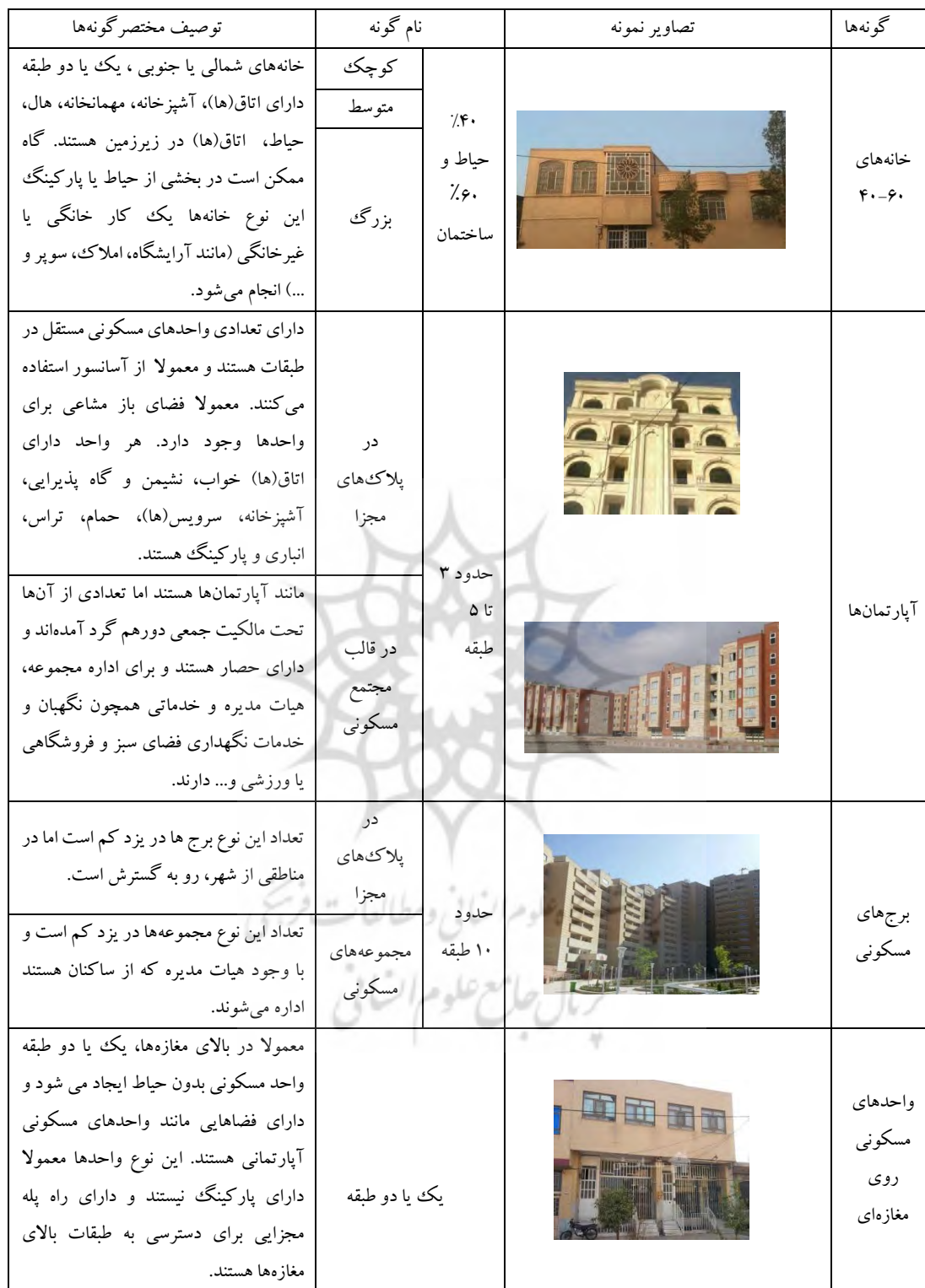
جدول ۱- گونه‌بندی خانه‌های امروزی یزد، (ماخذ: نگارنده)