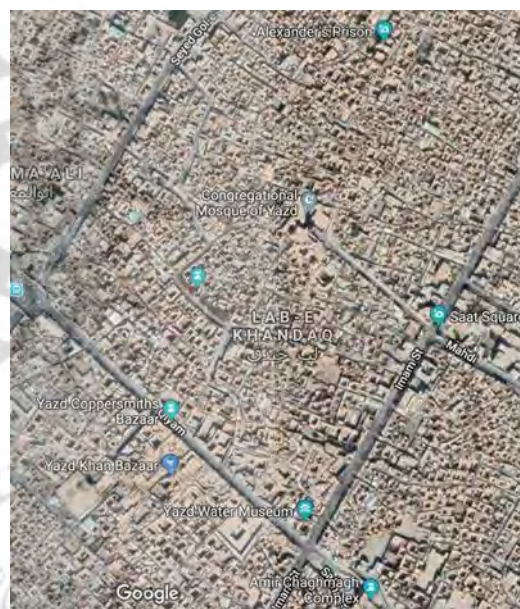
تصویر ۱- بخشی از بافت یزد، (ماخذ: Google map).

دارای بیشترین پایداری و منطقه دو که هسته اصلی شهر است و بافت تاریخی در ناحیه یک آن قرار دارد؛ ناپایدارترین منطقه است. منطقه یک که بافت میانه قدیم و جدید شهر است در سطح نیمه پایدار ارزیابی می‌شود» (پیرنیا و احمدی، ۱۳۹۳: ۱).