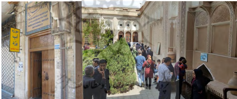
تصویر ۶- ورودی اصلی موزه و ورودی به قسمت نمایشگاهی موزه

۱- لابی ورودی برای مجموعه و فضاها مرتبط: پس از تأسیس موزه، طرح توسعه‌ای در نظر گرفته شد. با توجه به اینکه شأن ورودی رعایت نشده بود زمین همجوار خانه و دو مغازه اطراف آن خریداری شد؛ تا فضایی به عنوان پیش‌ورودی برای توجه بازدیدکنندگان قبل از ورود به موزه طراحی شود. بدین ترتیب که با استفاده از پروژکتور فیلم‌هایی در مورد تاریخچه خانه، ضرورت احداث موزه و معرفی بخش‌های مختلف موزه پخش شود.