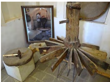
تصویر ۸- ادوات آسیاب در موزه آب یزد

قنات، وسایل تأمین روشنایی در قنات، مدارک خرید و فروش آب، کتابچه میراب ها و اسناد پخش آب، ظروف نگهداری و حمل آب، ظروف