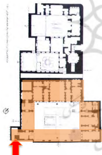
تصویر ۲- پلان خانه کلاهدوزها، (ماخذ: مرکز اسناد دانشکده هنر و معماری یزد)

قسمت حوضی قرار دارد که با عبور آب قنات از آن، هوای آن همیشه خنک و مطبوع است (سرداب). سطح سوم که همان زیرزمین خانه است به شمار می‌رود، دارای با اتاق و دالان‌های متعدد است که در روزهای گرم تابستان محل سکونت اهالی خانه بوده است و سطح چهارم که طبقه همکف می‌باشد، از بخش‌های مختلفی همچون اتاق‌های پنج‌دری، تالار، اتاق ارسی، آشپزخانه و محل زندگی خدمه خانه تشکیل شده و طبقه پنجم، پشت بام خانه است. در این طبقه، چاه‌خانه‌ای وجود داشته که با استفاده از چرخ چاه، از چاه‌های معروف چهل‌گز، آب را برداشت و جهت نظافت و آشامیدن در آب انبار طبقه همکف ذخیره می‌کردند (بختیاری، ۱۳۹۲: ۴۷۸).