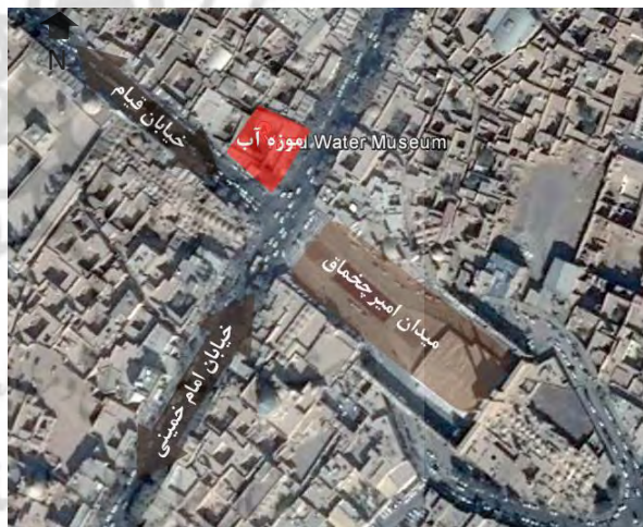
تصویر ۱- جانمایی موزه آب یزد، عکس هوایی یزد