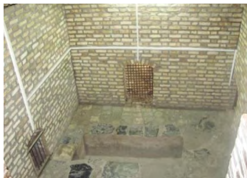
تصویر ۷- پایاب در موزه یزد

شاخص وجود نداشته باشد می توان به کمک نورپردازی یا کفسازی این امکان را فراهم آورد.