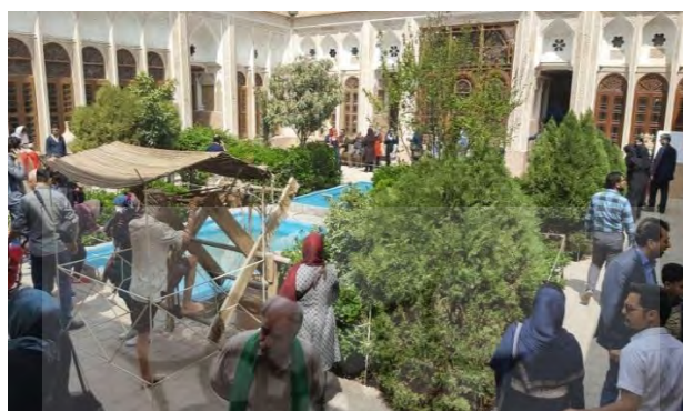
تصویر ۴- فضای باز موزه