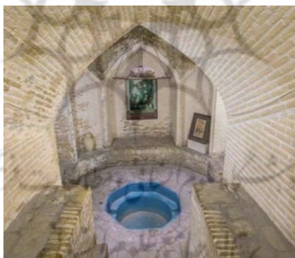
تصویر ۵- سرداب خانه کلاهدوزها

همچنین بنای خانه و نقوش گچ کاری زیبای آن یکی از آثار معماری سنتی ارزشمند در یزد است (سمسار یزدی، ۱۳۹۵).