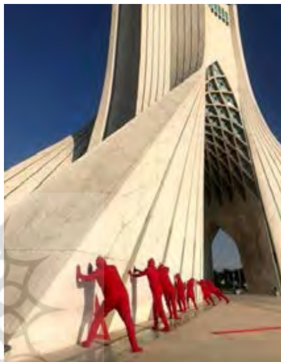
نصر ملکی، جابه‌جایی برج آزادی- یک سانتی متر نزدیکتر، (۱۳۹۹)