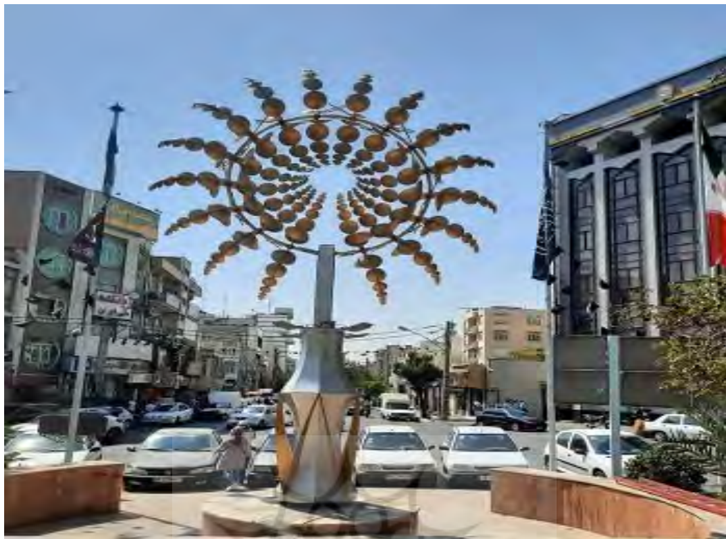
شکل ۲. نمونه‌ای از تصاویر گرافیک محیطی محله صادقیه تهران (المان متحرک خورشید)