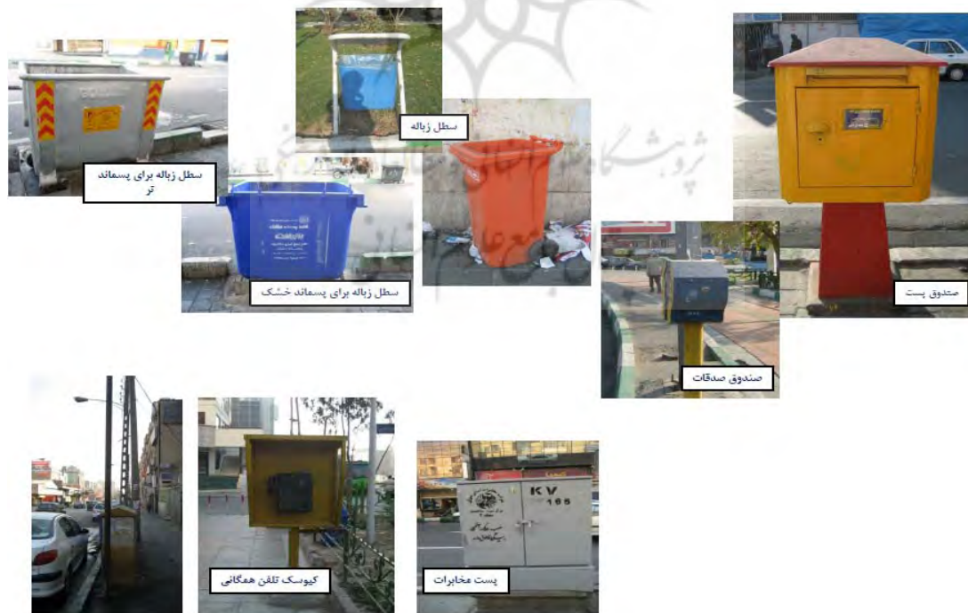
شکل ۳. نمونه‌ای از مبلمان شهری محله صادقیه تهران