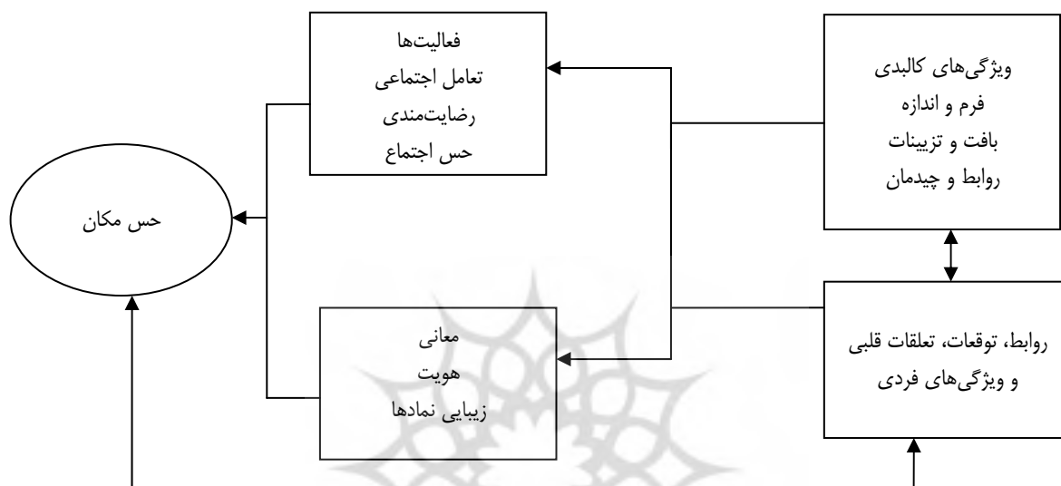
شکل ۱. مدل شمارگر کانتر

اجتماعی افراد یکی از مهم‌ترین فعالیت‌های انسانی در قرارگاه‌ها است، چگونگی فرایند ادراک نیز در ایجاد تصورات ذهنی و تعلق افراد نسبت به قرارگاه بااهمیت است. از سوی دیگر چگونگی نیاز افراد، توقعات آن‌ها از مکان و چگونگی ارتباط با مکان نیز از عوامل مؤثر در حس مکان افراد است و در بررسی و مطالعات، این عوامل باید مورد توجه قرار گیرند. ویژگی‌های کالبدی بر احساسات و ارزش‌گذاری‌ها نسبت به مکان تأثیر می‌گذارد و سازگاری قابلیت‌های محیطی و نیازهای انسان را به معیاری برای تفسیر رابطه انسان و مکان مبدل می‌سازد.