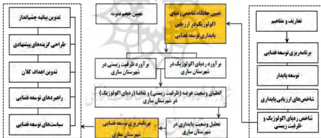
شکل ۴. روش‌شناسی پژوهش

پس از محاسبه و مقایسه ردپای اکولوژیک با ظرفیت زیستی شهرستان، گزینه‌های محتمل برای توسعه فضایی شهرستان ساری با توجه به پیشران‌های توسعه تدوین و با استفاده از روش دلفی متخصصین وزن‌دهی شده است. برای این منظور، آینده‌های محتمل برای هر پیشران توسط ۵ متخصص وزن‌دهی شده، وارد نرم‌افزار سناریویزارد شده و امتیاز نهایی توسط نرم‌افزار برآورد شده است. درنهایت، راهبردها و سیاست‌های همسو با گزینه مطلوب، جهت کاهش ردپای اکولوژیک و حرکت به سوی پایداری با استفاده از روش ماتریس SWOT تدوین و با استفاده از روش QSPM اولویت‌بندی شده است. به طور کلی مراحل انجام پژوهش را به طور خلاصه می‌توان به شرح شکل ۴ دانست: