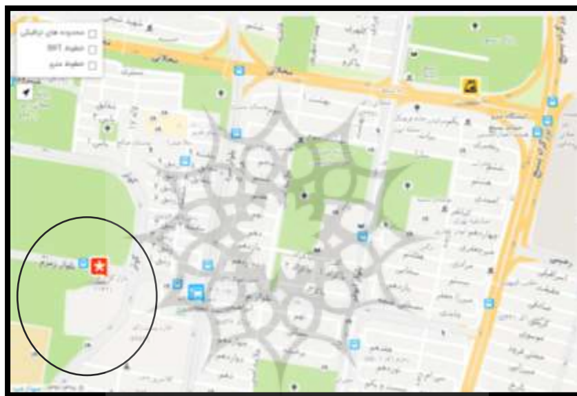
شکل ۳. موقعیت بازار گل محلاتی نسبت به منطقه ۱۴ شهرداری تهران

منطقه ۱۴ شهر تهران در شرق تهران قرار دارد و دارای شش ناحیه و ۲۶ محله است که بیشترین محلات را در بین مناطق تهران به خود اختصاص داده است. منطقه ۱۴ کنونی در شرق تهران، حد فاصل خیابان‌های هفده شهریور از غرب، خاوران از جنوب، بزرگراه بسیج از شرق و خیابان پیروزی از شمال قرار دارد. این منطقه در مجاورت مناطق ۱۲، ۱۳ و ۱۵ واقع گردیده است. وسعت منطقه با احتساب حریم، معادل ۲۲/۰۳ کیلومتر مربع است. محدوده مورد مطالعاتی یعنی بازار گل محلاتی به‌عنوان راسته تجاری در این محدوده قرار دارد و میتوان گفت تنها راسته عمده تجاری واقع در محدوده است.