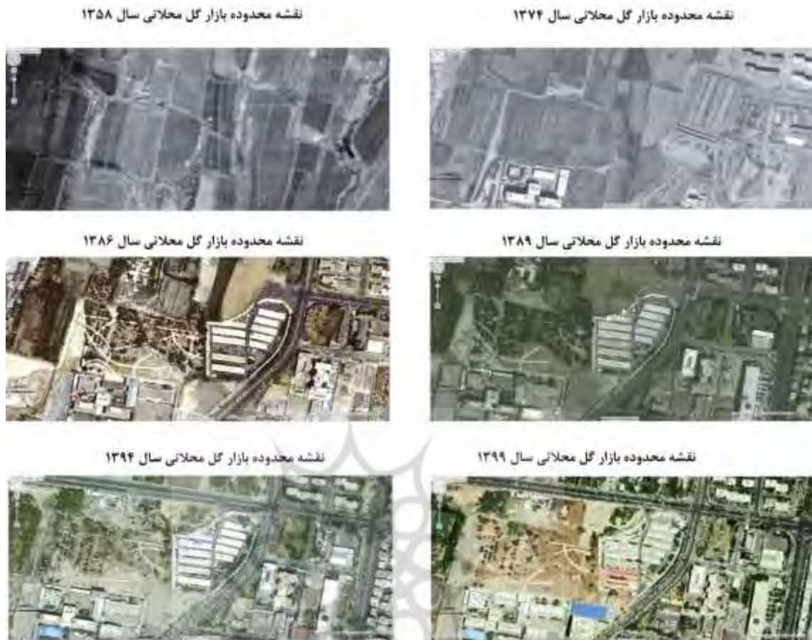
شکل ۴. تکامل بازار گل محلاتی از سال ۱۳۵۸ تا ۱۳۹۹