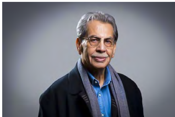
استاد کامبیز درم‌بخش - منبع تصویر: ایرنا.

استاد درم‌بخش فعالیت‌هایی در زمینه تبلیغات (طراحی روی جلد کتاب)، تصویرگری کتاب کودک، پوستر، فیلم کوتاه، کارت پستال، تقویم و مشابه آن‌ها