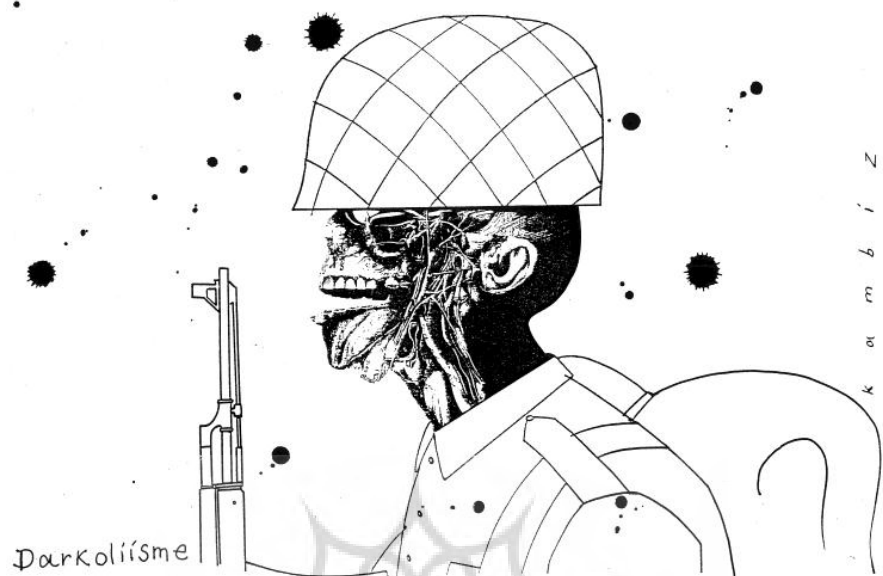
کاریکاتور ضد جنگ با موضوع معرفی مکتب ادبی دارکولیسم؛ اثر استاد کامبیز درمبخش، سال ۲۰۱۵ میلادی.