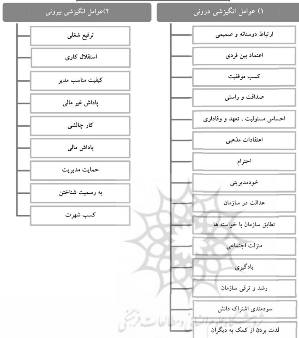
شکل (۱): اولویت بندی عوامل انگیزشی درونی و بیرونی موثر بر اشتراک دانش کارکنان