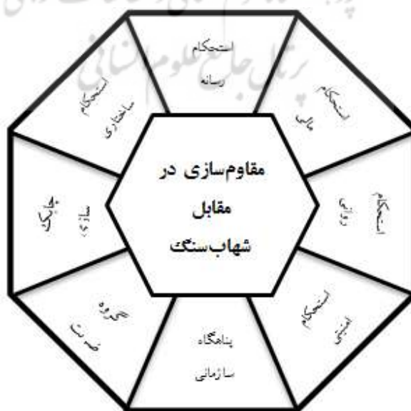
شکل ۲. مدل مقاوم‌سازی سازمان در مقابل شهاب‌سنگ‌های سازمانی