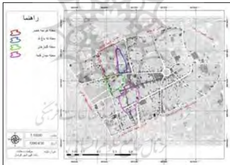
شکل ۲. موقعیت قرارگیری محلات چهارگانه در بافت قدیم

در این پژوهش بستر استفاده شده جهت تحلیل و بررسی، بافت قدیم شهر کرمان است و از آن جا که هدف پژوهش نمود ارزش‌های تاریخی و فرهنگی جهت پویایی محلات قدیمی بوده، چهار محله میدان قلعه، محله خواجه خضر، محله گلبازخان و ته باغ الله انتخاب شده اند. همچنین دو ساختار اصلی در بافت شهری کرمان و روند رشد آن را می‌توان مشاهده کرد. یکی ساختار خطی که بر اساس جاده‌ها در ابتدا و بازار در دوره‌های بعدی شکل گرفته است و دیگری ساختار متمرکز که به محله‌های مختلف در شهر شکل داده است. در واقع در درون بافت قدیم شهر می‌توان یک سری خطوط را به عنوان ستون فقرات شهر و یک سری نقاط را به عنوان سرچشمه رشد بافت متمرکز شهر در نظر گرفت (ایمانی، ۱۳۸۳: ۲۵).