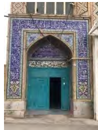
محله خواجه خضر

این محدوده حد فاصل بین خیابان های ابوحامد شمال، خیابان فلسطین در غرب، خیابان شهید چمران در شرق و خیابان فلسطین ۵ در جنوب واقع گردیده است .