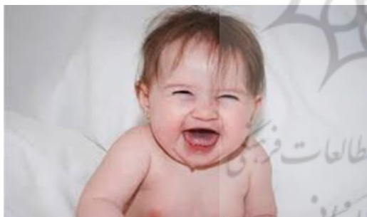
شکل ۲. نمونه‌ای از صحنه‌های استفاده شده جهت القای خلق مثبت و منفی