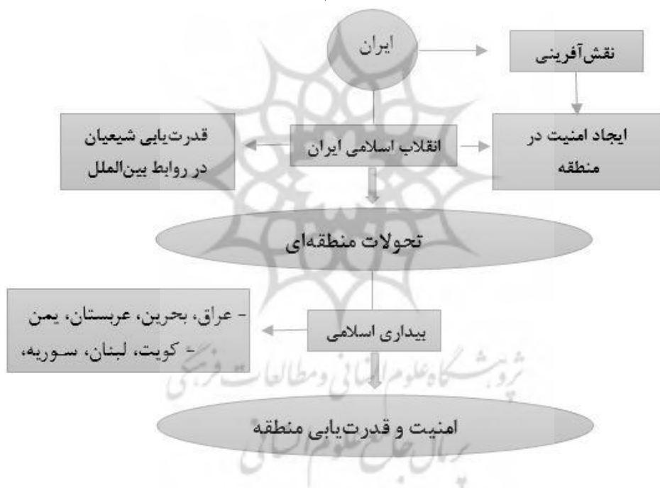
شکل شماره (۵): نقش انقلاب اسلامی در قدرت یابی و امنیت منطقه (مأخذ: قربانی سپهر،

قدرت یابی شیعیان در سطح بین‌المللی زمینه‌ای شد تا شیعیانی که در کشورهای حاشیه خلیج فارس تحت حاکمیت امرای سنی بودند، در حالی که اقلیت جمعیت آن شیخ‌نشینان را تشکیل می‌دادند، با احساس قدرت و غرور درصدد کسب هویت مجدد، قدرت و اجرای اعمال مذهبی بوده و عدم رضایت خود را نسبت به حکام ارتجاعی بروز دادند. این امر نه تنها در کشورهای حاشیه خلیج فارس بلکه در تمام کشورهای جهان که اقلیتی شیعه در آن وجود داشت، احساس قدرت نمودند. همانند گروه‌های شیعه و سنی از مصر همچون اخوان المسلمین و جهاد اسلامی تا جنبش مسلمانان مجاهد و حزب سلمانه اسلامی در مالزی، الهامات زیادی از انقلاب اسلامی گرفتند. در شکل شماره (۵): مدل شماتیکی از تأثیر انقلاب اسلامی بر امنیت و قدرت یابی کشورهای منطقه غرب آسیا و شکل‌گیری تحولات بین‌المللی را بیان می‌نمایم.