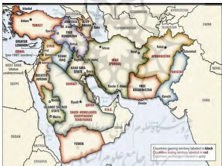
شکل (۴): نقشه طراحی شده ژنرال رالف پیترز براساس قومیت‌ها و مذاهب (Kurt, ۲۰۱۴: ۱۵)

و تلاش خود را کرده بود تا بتواند کشورهایی از جمله (سوریه، عراق، یمن، لبنان، افغانستان، پاکستان و ایران) را تجزیه و هرکدام را به چند کشور تجزیه نماید؛ اما جمهوری اسلامی ایران چون سدی در برابر سیاست‌های شوم آمریکا ایستاده و تمام ضربات آن‌ها تا به حال مهار کرده است. ایران توانست بر ناامنی عراق و سوریه پایان دهد و مانع از تجزیه عراق توسط کردها شود، امنیت را به قطر و یمن بخشید و آن‌ها را مورد حمایت خود قرار داد و همچنین تعدادی از کشورهای آفریقایی را امنیت بخشید؛ ولی هرچند که باز هستند کشورهایی که از ناملاطی‌های شوم سیاست‌های جهانی در فقر و ناعدالتی و ناامنی به سر می‌برند و امیدواریم که کشور ایران به عنوان قدرت منطقه‌ای بتواند در آینده‌ای نزدیک امنیت را به منطقه و جهان بازگرداند و زمینه صلح جهانی را فراهم آورد. شکل شماره (۴): توسط ژنرال رالف پیترز طراحی شده که در مجله نیروهای مسلح در ژوئن ۲۰۰۶ به چاپ رسید؛ وی معتقد بود که چنین نقشه‌ای براساس قومیت‌ها و مذاهب می‌تواند تنش‌ها را کاهش دهد.