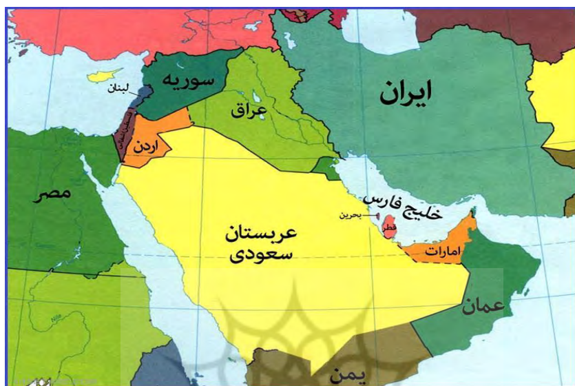
شکل (۳): منطقه غرب آسیا

بحرین، یمن، فلسطین اشغالی، اردن، سوریه، لبنان، کویت، مصر؛ که در این میان ایران همانند صدفی در میان مروارید در درون نقشه جغرافیایی جهان می‌درخشد.