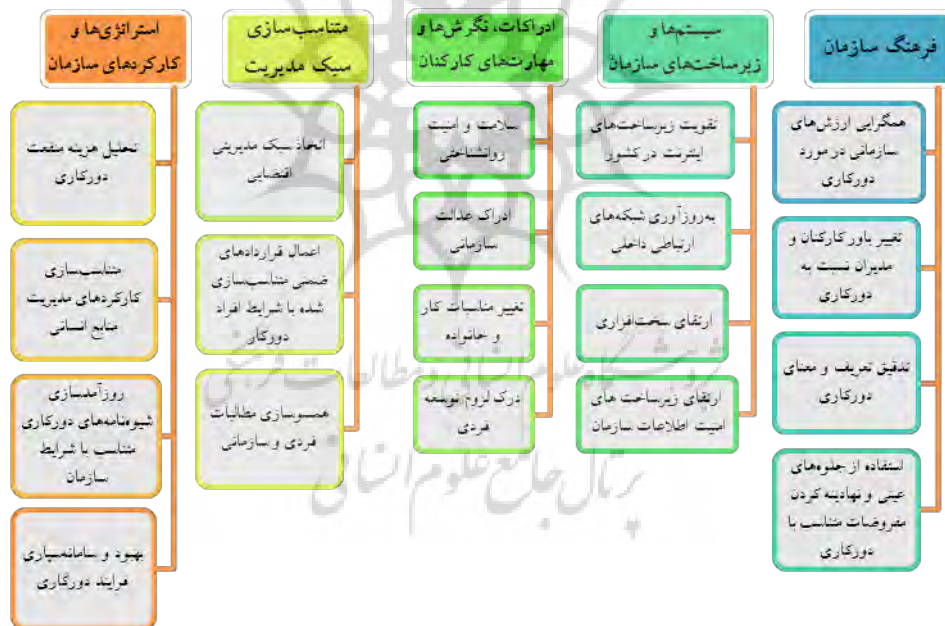
شکل شماره ۲: الگوی تم‌های اکتشافی شامل تم‌های اصلی و تم‌های فرعی

شکل ۲، الگوی تم‌های اکتشافی پژوهش حاضر شامل تم‌های اصلی و تم‌های فرعی مربوط به هر تم اصلی را نشان می‌دهد.