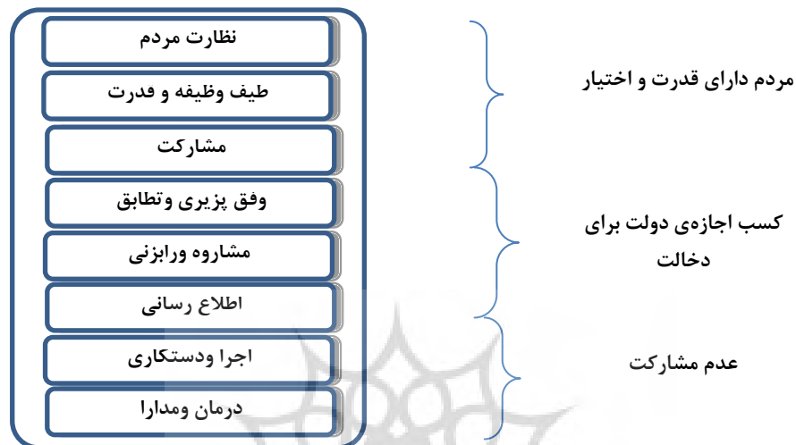
شکل شماره ۱: طرح نردبانی مشارکت (Aronstein, 2004: 2)

عضویت، تفویض اختیار و کنترل شهروند را در قالب قدرت شهروند دسته بندی کرد (Aronstein, 2004: 2).