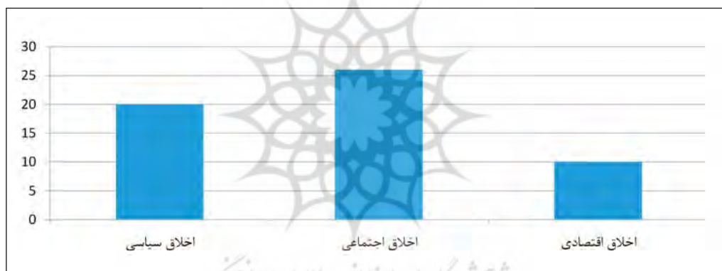
نمودار شماره ۲: یافته‌های آماری مربوط به درون‌مایه‌های فرعی مؤلفه‌های اخلاقی

بر این اساس، مضامین و درون‌مایه‌های اصلی مرتبط با مؤلفه‌های اخلاقی عبارت‌اند از: ۱. اخلاق سیاسی: سیاست در تاروپود زندگی انسان‌ها حضور چشمگیر دارد. در زندگی عملی نیز مباحث و مسائل سیاسی با سایر علوم، به‌ویژه علوم انسانی ارتباط و پیوند عمیقی دارد. درباره‌ی ارتباط سیاست و اخلاق، همواره بحث کرده‌اند؛ زیرا هر دو از شاخه‌های حکمت عملی‌اند که با بحث درباره‌ی ابعاد ظاهری و رفتاری انسان در پی سامان دادن به زندگی انسان و جامعه‌اند. وجود هر دو برای حیات جمعی انسان‌ها ضروری است. نه می‌توان در فقدان سیاست و سامان جمعی به شکوفایی اخلاق امید بست و نه نظم و ترتیب صحیح اجتماع،