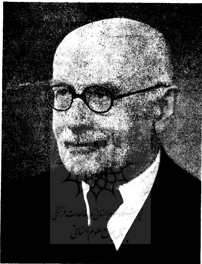
ایران‌شناس فقید، پروفیسور ولادیمیر فئودروویچ مینورسکی