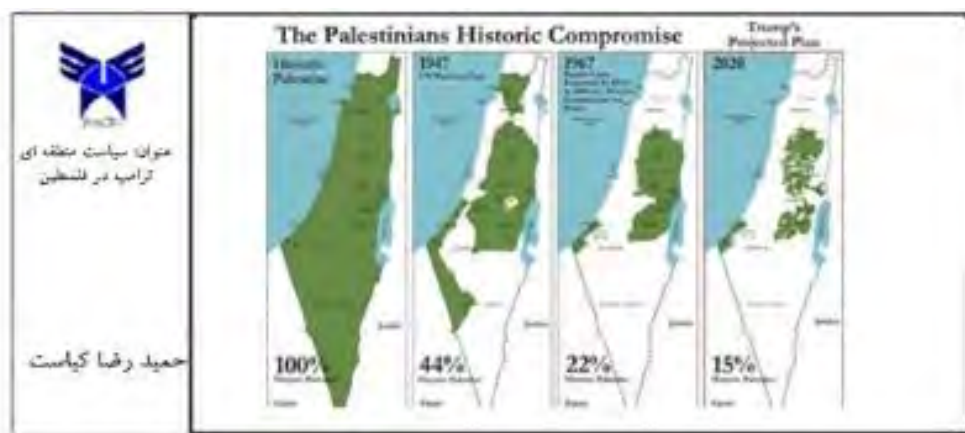
نقشه ۱. سیاست منطقه‌ای ترامپ در مورد خاورمیانه