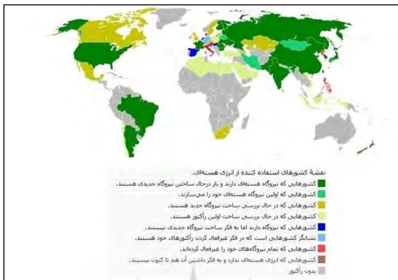
نقشه شماره ۱: کشورهای استفاده کننده از انرژی هسته ای

مجادله سیاسی قدرت‌ها در خصوص موضوع فناوری هسته ای جمهوری اسلامی ایران که ریشه اصلی آن عمدتاً در تعارضات ایدئولوژیک نهفته است، در سالهای اخیر فراهم کننده بستر مهیجی در جهان سیاست بوده و تحولات ناشی از آن نیز همواره منجر به شکل گیری دور جدیدتری از صف بندی قدرت‌ها و تداوم پیچیدگی‌های استراتژیک در نظام بین الملل بوده است. در سال ۱۳۸۲ با مطرح شدن تدریجی این موضوع در فضای بین المللی، مذاکرات پیچیده آن به میزبانی شهرهای ژنو، استانبول، وین، مسکو، بغداد، آلمانی و لوزان سوئیس با دو هدف اثبات ماهیت صلح آمیز بودن برنامه هسته ای از سوی ایران و نیز تضمین لغو تحریمها از سوی گروه ۵+۱ تا دستیابی به برنامه اقدام مشترک در ژنو (۱۳۹۳) و صدور بیانیه لوزان در فروردین ۱۳۹۴، همواره با کش و قوسهای متعدد تبلیغاتی، سیاسی و امنیتی همراه بوده است .