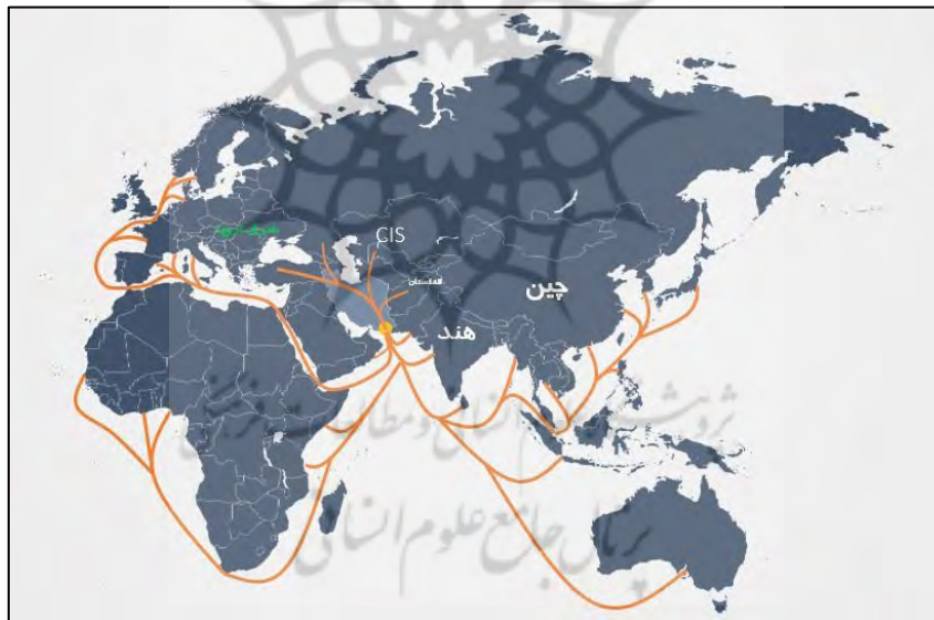
(سازمان منطقه آزاد چابهار، ۱۳۹۸)

براساس اعلام نظر محققان سازمان ملل در زمینه حمل و نقل بین‌المللی، حدود نیمی از حمل و نقل جهان، میان خاور دور با سایر نقاط دنیا انجام می‌شود. از مجموع سه کریدور حمل و نقل جهانی که کارشناسان سازمان ملل برای این امر پیش‌بینی کرده‌اند، دو کریدور از ایران می‌گذرد و چابهار جنوبی‌ترین نقطه کریدور شرقی - غربی جهان می‌باشد. این کریدور از «دروازه ابریشم» در چین آغاز می‌شود و قلب اقتصاد این کشور یعنی استان کانتون را تغذیه کرده و به سرزمین آسیای جنوب شرقی می‌پیوندد و پس از طی این مسیر وارد هندوستان شده و با پوشش مهمترین شهرهای این ناحیه مانند کلکته، ناکپور، جایپور، حصیرآباد، کراچی و بن قاسم به چابهار می‌رسد. بنا به نظر کارشناسان بندر چابهار، محل تلاقی دو کریدور ترانزیتی مهم جهان به نام‌های شمال - جنوب و شرق - غرب قرار گرفته است که این امر از مهم‌ترین مزیت‌های محور شرق کشور می‌باشد.