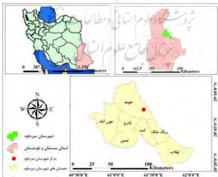
شکل (۲): موقعیت منطقه مورد مطالعه

شهرستان میرجاوه در شرق استان سیستان و بلوچستان واقع شده است و بیش از ۳۵۰ کیلومتر با کشور پاکستان هم مرز است. این شهرستان از شمال شرق، شرق و جنوب شرق به کشور پاکستان و از شمال و غرب با شهرستان زاهدان و در جنوب و جنوب غرب با شهرستان خاش ارتباط دارد. این شهرستان در ۲۹ درجه و ۱ دقیقه و ۴/۹ ثانیه عرض و ۶۱ درجه و ۲۷ دقیقه و ۲/۲ ثانیه طول جغرافیایی و با ارتفاع ۸۵۸ متر از سطح دریا واقع شده است. مسافت مرکز شهرستان میرجاوه تا مرکز کشور حدود ۱۹۰۰ کیلومتر می‌باشد. مساحت آن بیش از ۶۰۰۰ کیلومتر مربع می‌باشد و دارای سه بخش لادیز، ریگ ملک و مرکزی است، که از هفت دهستان تشکیل شده است که سه دهستان آن در بخش لادیز (لادیز، جون آباد، تمین)، دو دهستان در بخش مرکزی (حومه و انده) و دو دهستان نیز در بخش ریگ ملک (ریگ ملک و تهلاب) واقع می‌باشند.