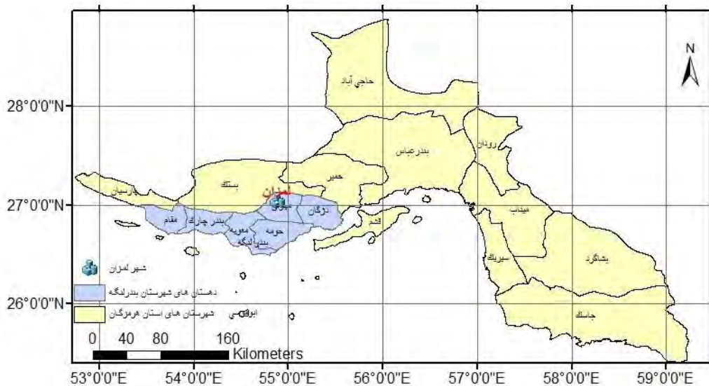
شکل (۲): نقشه موقعیت شهر لمزان در استان هرمزگان و شهرستان بندرلنگه و دهستان مهران