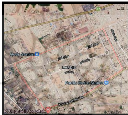
شکل ۳- عکس هوایی از حوزه مداخله