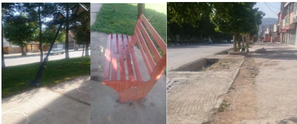
تصویر ۳: وضعیت نامناسب کفپوش در پیاده روها تصویر ۴: وضعیت نامناسب نیمکت و روشنایی بلوار

بررسی تطبیقی استانداردهای رایج مبلمان شهری با وضع موجود در محدوده مورد مطالعه