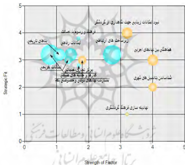
شکل شماره ۳. نقشه استراتژیک توسعه گردشگری سقز