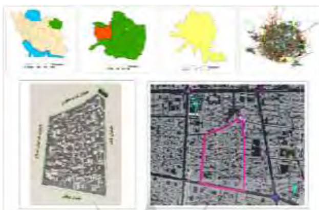
شکل ۳. محدوده محله سرده در شهر سبزوار. نقشه مبنا: کاربری اراضی شهر سبزوار (شهرداری سبزوار، ۱۳۹۰)

تقسیمات قدیمی شهر شامل کوی افتخارالحکما، کوی حمام آقا، خیابان بیهق شرقی، بازار بزرگ قدیم، و کوی قنبرسیاه است (محمدی، ۱۳۸۱: ۱۲۰). این محله از شمال به میدان فرمانداری (خیابان نواب صفوی)، از جنوب به خیابان بیهق، از شرق به خیابان قائم، و از غرب به خیابان فدائیان اسلام (شریعتمداری) ختم می‌شود. از نظر اجتماعی محله سرده جزو محلات متوسط‌نشین است و جمعیت آن به‌طور تخمینی در حدود ۲۵۰۰ نفر و مساحت آن ۹/۹ هکتار است. شکل ۳ موقعیت محدوده مورد مطالعه را نشان می‌دهد.