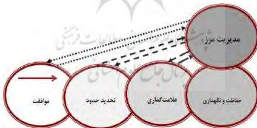
شکل ۱- مراحل تکامل خط مرزی

مرزها خطوطی هستند که حدود بیرونی قلمرو سرزمین تحت حاکمیت یک حکومت ملت-پایه را مشخص می کنند. مرز عامل تشخیص و عامل جدایی یک واحد متشکل سیاسی یا یک کشور از دیگر واحدهای مجاور آن است (حافظنیا، ۱۳۸۳، ص. ۶۹). مرزهای زمینی بین‌المللی، «به عنوان نقطه تماس میان کشورهای همسایه، در شکل‌دهی مناسبات سیاسی و اقتصادی آنها نقش برجسته‌ای به عهده دارند. مرزها به طور مکرر مسبب تنش‌هایی بین دولت‌ها بوده و قویاً کنش متقابل میان مردمانی که در مناطق مجاور هم به سر می‌برند را تحت تأثیر قرار داده‌اند. مرزهای [سرزمینی] بین کشورها هر چه عمیق‌تر در چشم‌انداز سیاسی و فرهنگی جای بگیرند، دوام آنها بیشتر خواهند بود. مرزهای [سرزمینی] بین کشورها باید مراحل را طی کنند تا به درجه تکامل برسند، هرچند گفتنی است که باید توسط دو دولت ذی‌ربط به رسمیت شناخته شده باشند، علامت‌گذاری شده باشند و به طور کارآمدی اداره و نگاهداری شوند. جونز (۱۹۴۵) معتقد است که مرزها در راه تکامل خود باید از سه مرحله بگذرند: ۱. تفاهم بر سر مکان تقریبی مرز، ۲. تحدید حدود، ۳. علامت‌گذاری بر روی زمین» (درايسدل و بلیک، ۱۳۷۰، صص. ۱۳۸-۱۰۱).