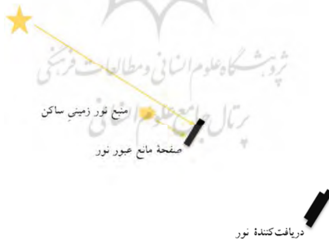
شکل ۳. طرح آزمایش بررسی استقلال سرعت نور از سرعت منبعش

آزمایشاتی که شروط فوق را ارضا نمی‌کنند، اگر چه که در تأیید یا نقض اصل «استقلال سرعت نور از سرعت منبعش»، آزمایشاتی قطعی محسوب نمی‌شوند، اما در صورت مغایرت نتایج آنها با اصل مذکور، می‌توانند احتمال غیر صحیح بودن اصل موضوع دوم را تقویت کنند. بنابراین پیگیری انجام چنین آزمایش‌هایی نیز خالی از فایده نخواهد بود. از این رو، تکرار آزمایش انجام شده توسط وُو و همکاران ( Wu et al., 2015) مفید خواهد بود. البته برخلاف ایشان که نور ستارگان و پرتو نور محلی را به‌طور هم‌زمان در محل فرستنده به پالس‌هایی ماجوله کرده‌اند و یک گیرنده واقع در دوردست، این پالس‌ها را شناسایی کرده و زمان‌های دریافت را ثبت کرده است، به‌نظر نمی‌رسد که ماجوله کردن و اعمال اثراتی اضافی بر روی نور که ممکن است بر صحت آزمایش مؤثر باشد، امری لازم و ضروری در روند انجام آزمایش باشد. از این رو، می‌توان آزمایش را به‌طور مستقیم به صورت زیر انجام داد (شکل ۳).