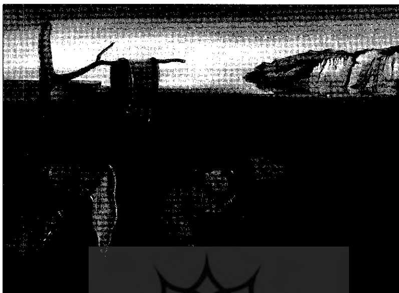
تداوم خاطره، ۱۹۳۱، اثر سالواتور دالی، موزه ی هنر مدرن نیویورک

و ترکیب توده ی مردم و به ویژه «تعداد روزافزون مشارکت کنندگان در اثر هنری» باعث «تغییر در شیوه ی مشارکت آن ها» شده است (ص ۲۳۹). یکی از تلویحات روشن این طرح کلی بنیامین این است که با توجه به رابطه ی میان قاعده هایی که اصول تولید یا اشکال باز نمود را تعیین می کند و مقوله هایی که تعیین کننده ی الگوهای ادراک و داوری درباره ی مخاطبان توده ای خاص است، می توان تاریخ دگرگونی ها در رابطه ی ما با آثار هنری را مشخص کرد. ۴