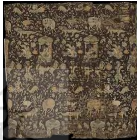
تصویر (۳) پارچه با نقش داستانی،

در تصویر شماره (۳)، برخلاف تصویر قبلی، به سکونت مجنون در میان دام و دد می‌پردازد و شخص سومی میان لیلی و مجنون قرار دارد که افسار شتر حمل‌کننده کژاوه لیلی را در دست گرفته و برای ترساندن شتر، چوبی را به حالت تهدید بالای سر برده است. نمی‌توان مطمئن بود، اما شاید منظور از این شخص، ابن‌السلام باشد؛ مردی که با لیلی ازدواج کرد. در این تصویر، نسبت به تصویر قبلی، تناسب کمتری میان نقوش جانوری برقرار است. برای نمونه اندازه جانوران و نیز فربگی و نزاری آن‌ها متفاوت است و حرکاتشان نیز انعطاف کمتری دارد. اما تیز و باریک بودن اغلب نقوش گیاهی زمینه، توانسته حرکات پیکره‌های جانوری را دربر گرفته و به آن‌ها روحی سرشار از شادابی و تحرک ببخشد. به نظر می‌رسد نگاه لیلی و مجنون در این طرح به یکدیگر دوخته شده است. رقم گیاه در بخش تحتانی کژاوه لیلی، درشتی و جلوه‌ای خاص دارد.