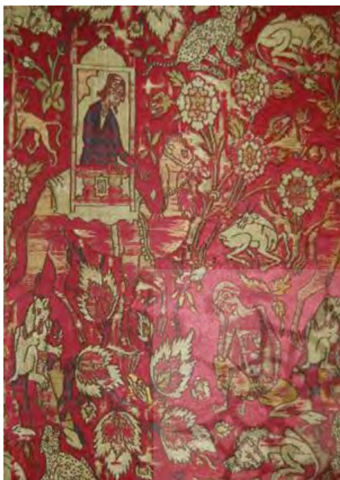
تصویر (۱) پارچه با نقش داستانی، اثر غیاث‌الدین نقش‌بند. در مالکیت کلکیان

صورت پذیرفته که چشم بیننده در نخستین نگاه، آنان را میان این شلوغی درمی‌یابد و این هنر طراح در مرکز‌نمایی طرح کلی است. نکته مهم اینجاست که این طرح از اسلوب نگارگری پیروی کرده، اما طراح دقیقاً می‌دانسته که چگونه باید طرح را متناسب با زمینه پارچه‌ای بیافریند. یعنی طراح فقط نگارگر نیست، بلکه مهندسی است که می‌داند چگونه باید یک طرح را با نوع بوم آن هماهنگ سازد. در نهایت، رقم غیاث که در قسمت پایینی کژاوه لیلی قید شده، کار را تکمیل می‌کند.