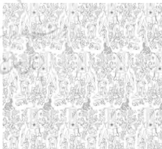
تصویر (۲) طرح خطی پارچه با نقش داستانی، اثر غیاث‌الدین نقش‌بند. نگارنده، ۱۳۹۳/۲/۲۰

( http://digitalcommons.unl.edu/cgi/viewcontent.cgi?article=1133&context=tsaconf 1392/11/21)