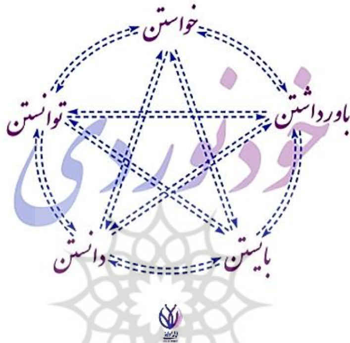
شکل ۲: مدل ره‌یاری نشانه‌شناختی مبتنی بر تعامل خودنوردی، و افعال وجهی مطرح در این مطالعه Figure 2: Semiotic coaching model based on the interaction between Khodnavardi, & the mentioned modal verbs in this study

شکل دایره‌ای این مدل را می‌توان از برخی جهات هم‌سو با میدان حضور، میدان گفت‌وگو، و میدان گفته‌پردازی که فونتنی مطرح می‌کند دانست. این مدل ویژگی‌هایی دارد که برخی از آن‌ها که در این مطالعه لحاظ شدند از این قرارند: باز، منعطف، سیال، چرخه‌ای، درهم‌تنیده، شبکه‌ای، انتخابی، به‌گزین، زایا، حضورینیا، و جز آن. مؤلفه‌های دیگری نظیر بدنمندی، تنش، هیجان، عاطفه، زیبایی‌آفرینی، خلاقیت، و مواردی مشابه وجود دارند که به این مدل مربوط می‌شوند، اما در پژوهش پیش‌رو مطرح نشدند. در این مدل، از هر سو و از هر طریق ارتباط میان افعال وجهی بدون ترتیب خاصی سیال، پیوسته، و برقرار است. همچنین، راه ارتباطی میان افعال وجهی به‌صورت نقطه‌چین است تا نه‌تنها نسبی بودن و مدرج بودن را نشان دهد، بلکه وضعیت