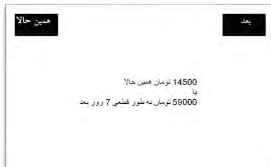
شکل ۱: نمونه‌ای از صفحه انتخاب

به منظور کنترل تأثیر ترتیب آزمایش‌ها نیمی از افراد مورد آزمایش ابتدا آزمایش ترجیحات بین‌زمانی و نیم دیگر ابتدا آزمایش اندازه‌گیری دین‌داری را تکمیل نمودند.