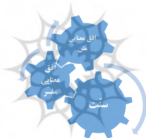
نمودار (۳) دور هرمنوتیکی از منظر گادامر (نوع دوم)