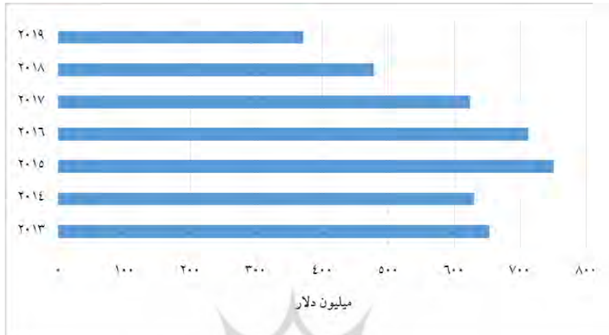
نمودار شماره ۲- وضعیت کمک‌های خارجی امریکا به پاکستان از ۲۰۱۳ به بعد

Source: (www.foreignassistance.gov, 2020)