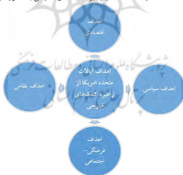
شکل شماره ۱- اهداف ایالات متحده از راهبرد کمک‌های خارجی به کشورهای مختلف

ایالات متحده امریکا با ارائه کمک‌های خارجی خود به کشورها، بازیگران و سازمان‌های بین‌المللی در تلاش است تا شعارهای هنجاری و آرمان‌گرایانه ارائه دهد اما با مطالعه کلی برنامه‌های امریکا می‌توان اذعان کرد که این کشور اهداف بسیار مهمی در زمینه‌های مختلف اقتصادی، سیاسی، نظامی، فرهنگی و ... در این خصوص دنبال می‌کند (Rothschild, 2007: 2-4). می‌توان اهداف اصلی امریکا از ارائه کمک‌های خارجی را به صورت مشخص شده در شکل شماره یک تشریح کرد: