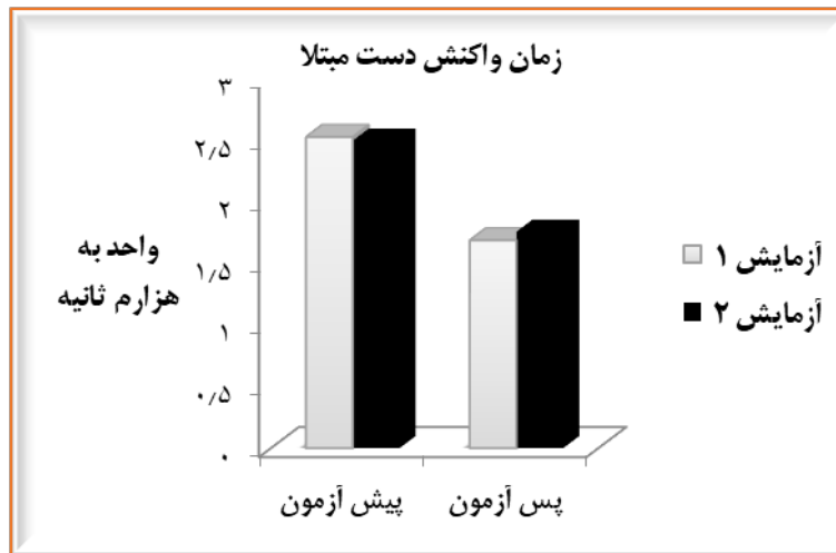
نمودار ۱. مقایسه پیش آزمون و پس آزمون زمان واکنش در دو گروه آزمایش