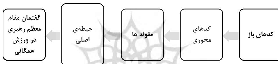
شکل ۱- ظهور حیطه اصلی بر خواسته از تحقیق است که تمام مفاهیم (کدهای باز، محوری، مقوله‌ها) ذیل این حیطه اصلی قرار می‌گیرند.

بر اساس نتایج جدول (۲)، از مجموع کدهای محوری برآمده از تحقیق، ۸ مقوله اصلی سلامتی، سازمانی و مدیریتی، اجتماعی، راهبردی، معنوی، ولایی، حکومتی و قهرمانی استخراج گردید. در ادامه، همان‌طور که در شکل (۱) مشاهده می‌کنید از تمام مفاهیم استنباط شده تحقیق، یک حیطه اصلی با عنوان گفتمان مقام معظم رهبری در ورزش همگانی استنباط گردید. این مهم نمایانگر آن