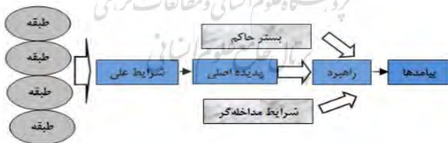
شکل ۱- مدل پارادایمی کدگذاری محوری Figure 1- Axial Coding Paradigm Model

استراوس و کوربین، این روش کدگذاری را که به آن «مدل پارادایمی» کدگذاری محوری گفته می‌شود، ارائه کردند. به این دلیل به این روش، «محوری» گفته می‌شود که کدگذاری حول «محور» یک طبقه انجام می‌شود (استراوس و کوربین، ۱۹۹۸) (شکل شماره یک)؛