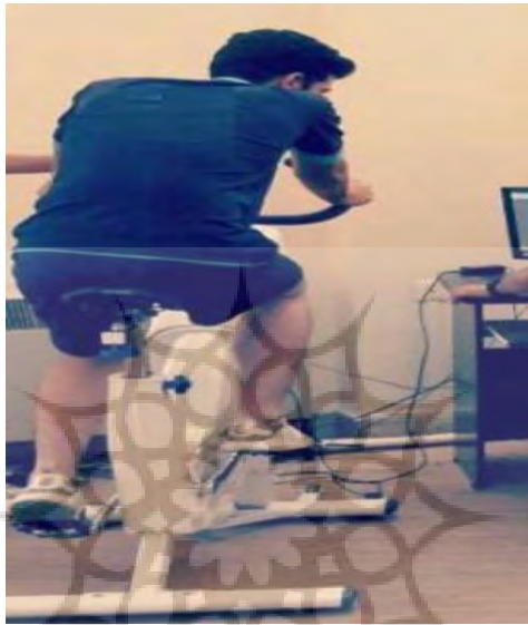
تصویر ۲- دوچرخه وینگیت