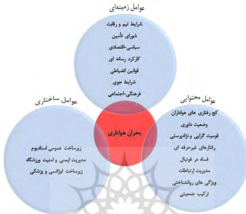
شکل ۱. مدل سه شاخگی عوامل مؤثر بر بحران

همان طور که در مدل پژوهش (شکل ۱) نیز قابل مشاهده است، از بین ۱۸ مقوله فرعی مؤثر بر بحران هواداری، ۳ مقوله در شاخه ساختاری، ۸ مقوله در شاخه محتوایی و ۷ مقوله در شاخه زمینه‌ای قرار گرفتند. در ادامه نیز مقوله‌های مربوط به هر شاخه با روش تحلیل سلسله‌مراتبی اولویت‌بندی شده است.