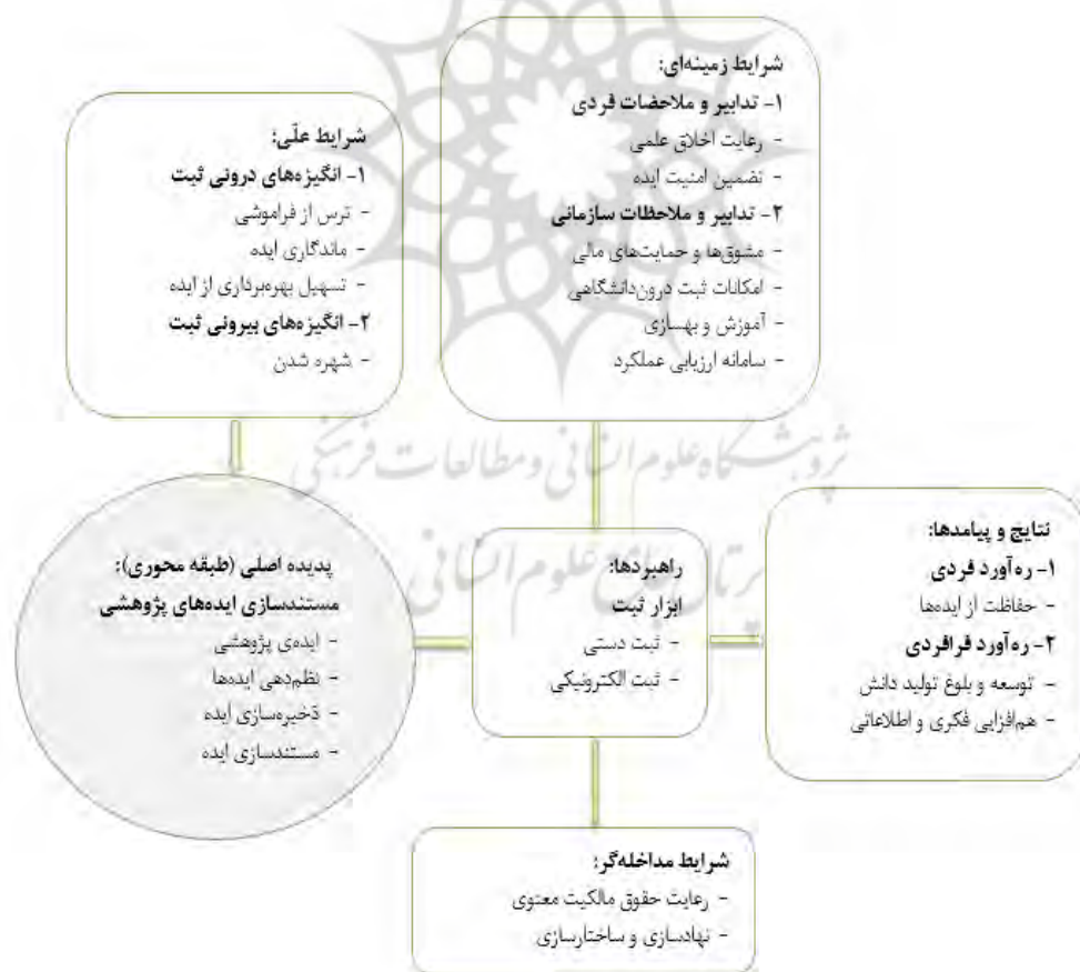
شکل ۱. الگوی پارادایمی مستندسازی ایده‌های پژوهشی اعضای هیئت علمی

روایت داستان مستندسازی ایده‌های پژوهشی اعضای هیئت علمی بدین ترتیب است که انگیزه‌های درونی و بیرونی ثبت ایده از جمله، ترس از فراموشی، ماندگاری ایده، تسهیل بهره‌برداری ایده و شهره شدن تمایل به ثبت ایده پژوهشی اعضای هیئت علمی را فراهم نموده است. برای ثبت ایده، آنان از راهبرد ثبت دستی و ثبت الکترونیکی بهره می‌برند. در این میان شرایط زمینه‌ای و محیطی و شرایط مداخله‌گر و میانجی بر کیفیت ثبت دستی و ثبت الکترونیکی اثرگذار خواهد بود. از این رهگذر، ره‌آورد فردی و فرافردی ثبت ایده، پیامدهای ماندگار ثبت ایده‌های پژوهشی اعضای هیئت علمی پیشکسوت بوده است (شکل ۱).