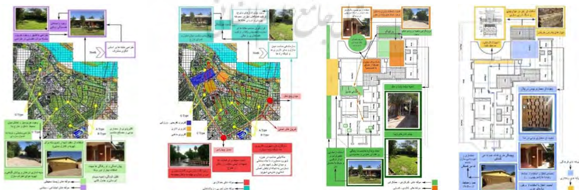
شکل ۱: مولفه‌های (درونی و بیرونی) در نیوسایت بر اساس مشاهدات میدانی؛ ماخذ: نگارندگان

دلایل انتخاب نمونه‌های موردی تحقیق؛ نمونه فوق‌الذکر از میان نمونه‌های موفق شرکت‌شهرهای نفتی (نیوسایت) بر حسب پیشینه ساخت و نظام فکری و شکلگیری خاص خود نسبت به دیگر موارد اولویت تحقیق می‌یابد. همچنین به لحاظ وسعت و تنوع مسکن می‌تواند حاوی مضامین و مولفه‌های معماری و شهرسازی درخوری باشد که در سایر موارد مشابه قابلیت استفاده نیز داشته باشد. به عبارت دیگر به دلیل انطباق بیشتر این نمونه با نظام معماری و شهرسازی مذکور و به لحاظ امکان بهتر آزمون مبانی فکری پژوهش چه به لحاظ معماری و چه به لحاظ شهرسازی نمونه مذکور اولویت دارد. همچنین مفاهیم راهبردی تحقیق حاضر نمی‌تواند در سایر موارد در برخی به دلیل متصل شدن به بافت شهری پیرامون و در برخی دیگر به دلیل دوری از هسته مرکزی شهر به خوبی به بوت‌آزمایش قرار داده شوند. همچنین از نظر تنوع نمونه‌های معماری مسکن و ساختار هندسی و جانمایی شهری و رضایت نسبی ساکنین که مبنای دسته‌بندی‌های اصلی این پژوهش بوده است؛