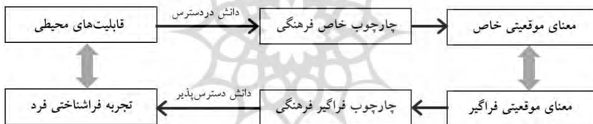
شکل ۱: فرایند ادراک معنای موقعیتی در مطالعات محیطی (بر اساس Alinam, Pirbabaei and Gharehbaglou 2023; Oyserman et al. 2014) Fig. 1: The process of perceiving situated meanings in environmental studies (Based on Alinam, Pirbabaei and Gharehbaglou 2023; Oyserman et al. 2014)

طبق این نظریه، فرهنگ به مثابه معنایی موقعیتی است که در دوسطح فراگیر و خاص قابل بررسی است. سطح فراگیر فرهنگ در پاسخ به نیازهای فراگیر است. در این سطح