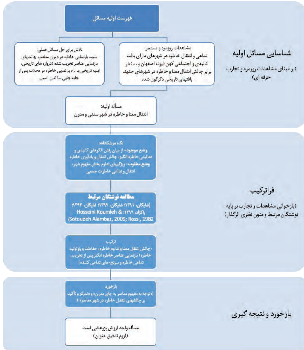
شکل ۳. ارزیابی مسئله شماره یک (انتقال معنا و خاطره در شهر سنتی و مدرن) از حیث ارزش پژوهشی

پس از تهیه فهرست اولیه مسائل مرتبط با خاطره جمعی، ارزیابی این مسائل بر پایه فرآیند چهارمرحله‌ای مبتنی بر فراترکیب و دریافت بازخورد صورت می‌پذیرد. جدول ۲ به صورت عام و اجمالی فرآیند ارزیابی مسائل یازده‌گانه را نشان می‌دهد. در «نگاه موشکافانه»، موضوعات بیانگر شکاف وضع موجود و شرایط مطلوب مورد اشاره قرار گرفته و پس از آن «مطالعه اجمالی» در نوشتگان مرتبط با مفاهیم مربوطه و سپس «تحلیل» ترکیبی و «جستجوی بازخورد» از اساتید راهنما و جامعه علمی و نتیجه‌گیری صورت پذیرفته است. در اینجا بازخورد به صورت مستقیم از اساتید راهنما و هم‌میزان بیرونی (سایر صاحب‌نظران مندرج در پانویس پنجم) دریافت شده است. بر پایه شکل ۲، در این بخش، ارزیابی چهارمرحله‌ای دربرگیرنده فراترکیب مطالعات و متون نظری و دریافت بازخورد از اساتید و خبرگان است. به عبارت دیگر، نگاه موشکافانه به مقایسه وضع موجود و وضع مطلوب و مفاهیم به‌دست‌آمده از آن زمینه‌ساز فراترکیب نوشتگان مرتبط با مسائل اولیه و یا مطالعات بنیادی