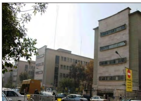
شکل ۱۵. نمای مدرن چهار بلوک شرقی کاخ وزارت دارایی

پلان ساختمان، غیرمقارن و از تداخل یک سری اشکال مربع مستطیل و نیم‌دایره شکل گرفته است. نماها نیز غیرمقارن و با ترکیب خطوط مستقیم و منحنی طرح شده‌اند. بام ساختمان مسطح و نمای ساختمان سیمانی است و همانند دیگر کارهای وارطان به این سبک، دارای تقسیم‌بندی‌های مستطیل‌شکل است. ترکیب پرگولای چوبی با بدنه سیمانی به آن ویژگی خاصی بخشیده است. سازه بنا دیوار باربر است. ساختمان دارای نرده‌های فلزی استریم لاین و یا موج‌دار و زیگزاک‌شکل است که از نمادهای بارز سبک آرت دکو است. تنها رجعت تاریخی در این ساختمان، مجسمه‌های آن است که با اقتباس از مجسمه‌های مصر و یونان باستان طراحی شده‌اند. احتمالاً نصب این مجسمه‌ها بدین لحاظ بوده که فوزیه مصری‌تبار و خواهر ملک فاروق، پادشاه مصر بود. در سایر موارد، هیچگونه نماد و یا تزئینات تاریخی در بنا ملاحظه نمی‌شود. بی‌تردید یکی از منحصر به فردترین ساختمان‌ها به سبک آرت دکو در این دوره که غالب خصوصیات این سبک در آن به صورت هنرمندانه‌ای طراحی شده، کاخ سعدآباد است.