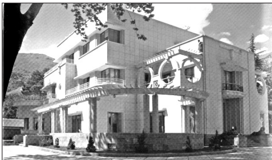
شکل ۱۱. نمای شرقی و جنوبی کاخ شهناز در سعادت‌آباد تهران

تأثیراتی از سایر سبک‌ها هرچند به صورت محدود در بنای سمت غرب نیز ملاحظه می‌شود. در کتیبه بالای تعدادی از پنجره‌ها، کاشی‌های لعابدار فیروزه‌ای با نقوش اسلیمی قرار دارد. یک بالکن مرتفع با دو ستون شبه دوریک - به سبک معماری نئوکلاسیک - بر محور میانی بنا در سمت شمال و جنوب آن قرار دارد. پس از ۶۱ سال، این بنای پنج طبقه اولین ساختمان بلند مرتبه تهران بعد از احداث عمارت شمس‌العماره در سال ۱۲۴۶ شمسی در پایتخت است.