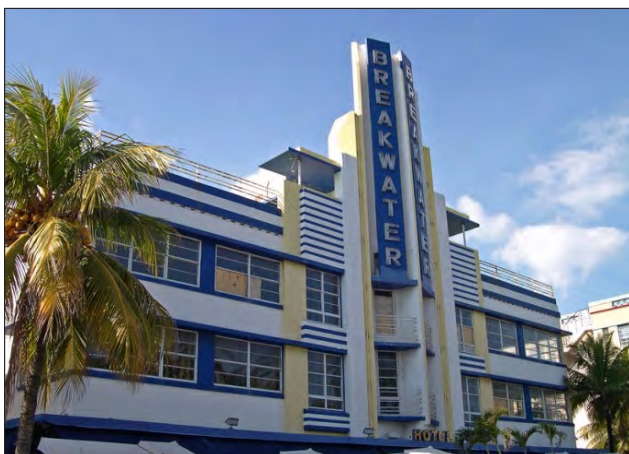
شکل ۵. هتل بیلک واتر در میامی آمریکا منبع: www.pozpictures.com 2012/7/8