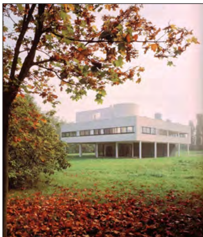
شکل ۹. ویلا ساوا در فرانسه