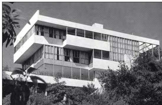
شکل ۸. خانه لاول در کالیفرنیا

خصوصیات شاخص سبک بین‌الملل را می‌توان عدم رجعت به تاریخ و گذشته، عدم استفاده از تزئینات، استفاده از هندسه اقلیدسی، استفاده از مصالح و فناوری مدرن، به‌کارگیری پلان‌ها و نماهای متقارن و نیز غیرمتقارن و همچنین وجود بام مسطح در کالبد آن بیان نمود.