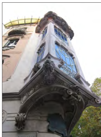
شکل ۴. نمونه معماری آرت نووو (شیوه تزئینات گیاهی)، تورین - ایتالیا

نمادهای بارز این سبک را می‌توان عدم رجعت به تاریخ و گذشته، استفاده از مصالح و فناوری مدرن، استفاده از خطوط مستقیم و استریملاین، استفاده از تزئینات نوظهور و صنعتی، به‌کارگیری پلان‌ها و نماهای متقارن و غیرمتقارن و بالای برج‌ها به صورت پلکانی بیان نمود. در کنار سبک آرت دکو، به‌صورت روز افزونی بر اهمیت و اعتبار سبک دیگری به نام «سبک بین‌الملل» افزوده شد. در سال ۱۹۳۲ م. (۱۳۱۱ ه.ش.) نمایشگاهی در موزه هنرهای مدرن در شهر نیویورک به نام سبک بین‌الملل توسط هنری راسل هیچکاک ۲۰ و فیلیپ جانسون ۲۱ برگزار شد. از جمله ساختمان‌های مهمی که در این نمایشگاه به عنوان نمادهای سبک بین‌الملل عرضه شد می‌توان از مدرسه باهاوس در آلمان (۱۹۲۶ م.) توسط والتر گروپیوس ۲۲ ، پاریس آلما در اسپانیا (۱۹۲۹ م.) توسط میس ون درروهه ۲۳ ، خانه لاول در آمریکا (۱۹۲۹ م.) توسط ریچارد نوتر ۲۴ و ویلای ساووی در فرانسه ۱۹۳۰ م. توسط لوکوربوزیه ۲۵ نام برد. پس از پایان نمایشگاه، کتابی به همین نام (سبک بین‌الملل) توسط هیچکاک و جانسون منتشر و اصول و مشخصات این سبک در آن تدوین شد (Hitchcock, 1997).