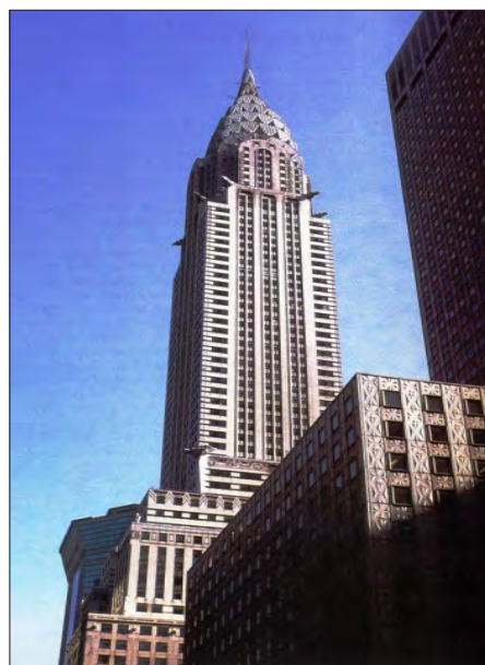
شکل ۲. برج کرایسلر در نیویورک