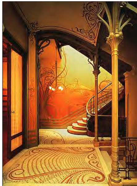
شکل ۱. تزئینات در معماری آرت نووو، اثر ویکتور هورتا

شاعرانه شد. بدین ترتیب به جای اینکه شکاف بین اندیشه و احساس را برطرف سازد، راه افراط در پیش گرفت و به همین دلیل پس از معدود سال‌های حیاتش پژمرده شد. معماری جدید باید برای مدرن شدن، تعبیر ساده‌تری از خاستگاه‌هایش به دست می‌داد.» (نوربرگ شولتز، ۱۳۸۶، ۵۶). این جاست که معماری مدرن، در ورای نگرش‌های آرت نووو، پا به عرصه معماری مدرن عالییه با سبکی به نام آرت دکو می‌گذارد. در ساختمان‌های کوتاه‌مرتبه این سبک، تأکید بر خطوط افقی ممتد (استریم لاین) ۱۲ و در مواردی احداث یک برج مرتفع در میان ساختمان بود. بالای برج غالباً به شکل پله‌ای طراحی می‌شد. تزئینات جذاب با استفاده از خطوط انحنا دار و نرم و یا خطوط زیگزاگ‌مانند و به‌کارگیری رنگ‌های روشن و اولیه و لامپ‌های نئون جزء ویژگی‌های این سبک محسوب می‌شود. در پیش و ابتدای دوره معماری مدرن عالییه (۱۹۱۸-۱۹۳۹ م. / ۱۲۹۷-۱۳۱۸ ه.ش.) سبک آرت دکو و سبک بین‌الملل از جمله سبک‌های مهم بودند. آرت دکو نام خود را از «نمایشگاه بین‌المللی هنر تزئینات و صنعت مدرن» ۱۳ که در سال ۱۹۲۵ م. (۱۳۰۴ ه.ش.) در پاریس برگزار شد، به عاریت گرفت. آرت دکو از یک جریان منحصراً فرانسوی به سرعت به صورت یک مد بین‌المللی در طراحی، تزئینات داخلی و معماری در آمد. این سبک به صورت یک نمایش جدید با نمادهایی مصنوعی بود که بین سنت‌گرایی و آینده‌نگری قرار داشت و می‌توان گفت که تحت تأثیر کوبیسم، فوتوریسم، اکسپرسیونیسم و دیگر نهضت‌ها بود (Lampugnani, 1997, 17). هدف نمایشگاه مذکور آشتی دادن هنر و صنعت و به‌کارگیری آنها در کنار یکدیگر به صورت زیبا و هنرمندانه بود. این موضوع در سبک آرت دکو نمودی بارز و غالب دارد.