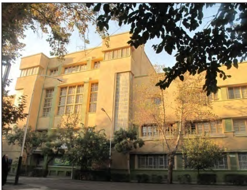
شکل ۱۳. نمای جنوبی ساختمان هنرستان دختران