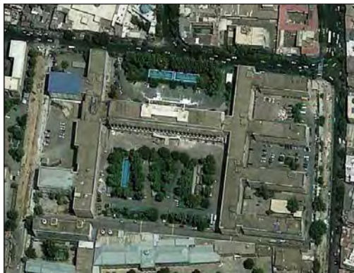
شکل ۱۲. سایت پلان کاخ وزارت دارایی، خیابان باب‌همایون