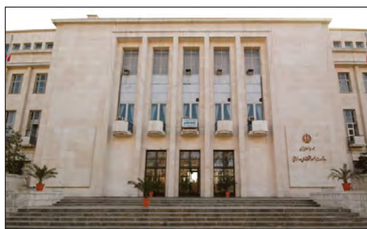
شکل ۱۴. نمای شمالی عمارت مرکزی کاخ وزارت دارایی