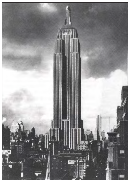
شکل ۳. برج امپایر استیت در نیویورک منبع: Curtis, 1996, 226

سبک آرت دکو برای احداث ساختمان‌های بلندمرتبه نیز مورد توجه بود. در ساختمان‌های بلندمرتبه، تأکید بر خطوط عمودی بوده است. مرتفع‌ترین آسمانخراش‌های آمریکا (و به عبارتی دنیا) در دوران رکود بزرگ اقتصادی (۱۹۲۹-۱۹۳۹ م.) به این سبک ساخته شدند. ساختمان کرایسلر ۱۴ (۱۹۲۷-۱۹۳۰ م.) در نیویورک توسط ویلیام ون آلن ۱۵ طراحی شد و شاخص‌ترین ساختمان این سبک محسوب می‌شود. این ساختمان با ۳۱۹ متر ارتفاع، بلندترین ساختمان در جهان تا قبل از احداث برج مرتفع دیگری به همین سبک به نام امپایر استیت ۱۶ (۱۹۳۴ م.) در نیویورک بود. این برج به ارتفاع ۳۸۱ متر، تا زمان افتتاح برج شمالی ساختمان دوقلوی مرکز تجارت جهانی ۱۷ در نیویورک در سال ۱۹۷۳ م. (به مدت ۴۲ سال) بلندترین ساختمان جهان بود. به هر حال، آنچه ساختمان کرایسلر را با نگرشی سبکی متمایز می‌سازد (هنر تزئینی، آرت نووو و یا شاید اکسپرسیونیستی)، این است که قالب‌های آن از ظریف‌ترین شکل‌ها در زمینه طراحی آسمانخراش تا آن تاریخ بوده است (کرتیس، ۱۳۸۲، ۲۳۷). برج مرتفع مرکز راکفلر ۱۸ (۱۹۳۱-۱۹۴۰ م.) و تالار موسیقی رادیوسیتی ۱۹ (۱۹۳۲ م.) هر دو در نیویورک، جزء بهترین نمونه ساختمان‌های ساخته شده به این سبک است. قسمت فوقانی هر سه برج معروف به صورت پلکانی طراحی شده است. سبک آرت دکو در نقاشی، گرافیک، مجسمه‌سازی و نیز تزئینات پیروان بسیاری داشت.