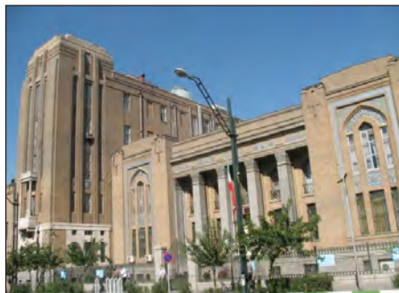
شکل ۱۰. نمای جنوبی کمپانی نفت ایران و انگلیس، برج آرت دکو