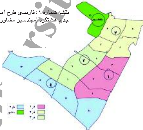
نقشه شماره ۱: فازبندی طرح آماده‌سازی شهر جدید هشتگرد (مهندسین مشاور پیکده، ۱۳۸۶)

احداث، خصوصاً شهرهای جدید اطراف تهران، از موقعیت نسبتاً مطلوبی در جذب و اسکان جمعیت برخوردار است. اما این شهر به لحاظ کیفیت‌های فضایی و شرایط زندگی با وضعیت مطلوب فاصله زیادی دارد. همچنین با توجه به اینکه هشتگرد نیز مانند اکثر شهرهای جدید دیگر در مراحل اولیه ساخت و اسکان قرار دارد، دارای پتانسیلهایی برای تأمین نیازهای مادی و معنوی ساکنان است که در کمتر شهر جدیدی در ایران مشاهده می‌شود. انتخاب فاز ۱ تنها به این دلیل بوده که نخستین ساختمان‌های شهر جدید در این فاز بنا شده، مهاجران نخست شهر را سکنه این منطقه تشکیل می‌دهند و از بافت منسجم‌تری برخوردار است.