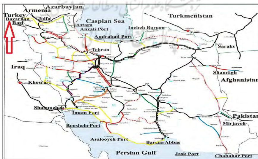
نقشه ۳: موقعیت اقتصادی منطقه مورد مطالعه

در سال ۱۳۷۷ نیز سازمان پایانه‌ها اقدام به ساخت ساختمان جدیدی به مساحت ۴۵۰ مترمربع نمود. گمرک مزبور در حال حاضر در سطح مدیر کل و به منظور انجام امور مختلف گمرکی شامل مسافری، واردات، صادرات، ترانزیت، قضایی فعالیت نموده و همچنین گمرک پلدشت و بازارچه‌های ساری سو و صنم بلاغی تحت مدیریت گمرک بازرگان مشغول فعالیت می‌باشند. شهر بازرگان از توابع شهرستان ماکو و در ۱۵ کیلومتری شمال آن قرار گرفته است. بازرگان به عنوان نقطه خروجی مرز ایران و ترکیه در دامنه