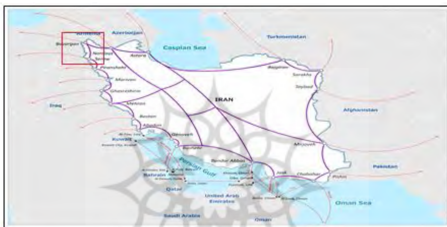
نقشه ۱: موقعیت مرز بازرگان

مابین ایران و ترکیه است. نام این گذرگاه از طرف کشور ترکیه مرز گوربولوغ است (زرقانی، ۱۳۸۶: ۳۴-۱۸). گمرک بازرگان در سال ۱۳۰۵ از زمانی که روستای بازرگان حدود ۴۰ خانوار جمعیت داشته، در این منطقه مستقر بوده است، بنای اولیه این گمرک یک اتاق گلی به همراه ۴ تا ۵ نفر از پرسنل بوده که به دلیل کمبود امکانات و مشکلات پشتیبانی برای مدتی به شهر ماکو منتقل شده است. با توجه به درخواست تاجران و مسافران برای انجام تشریفات گمرکی در مرز، گمرک مجدداً در سال ۱۳۱۴ به