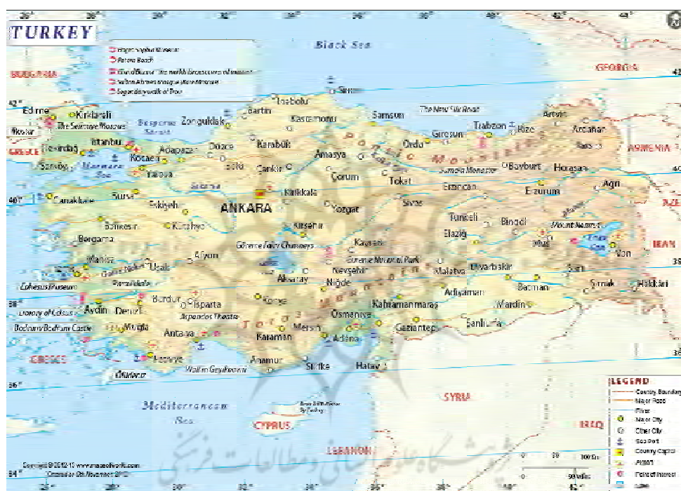
نقشه ۴: موقعیت ژئوپلیتیکی مرزهای ایران و ترکیه

مرز بازرگان از مهم ترین نقاط گمرک ایران است و در فاصله یک کیلومتری شهر بازرگان واقع در شهرستان ماکو در استان آذربایجان غربی قرار دارد. این گمرک در سال ۱۳۰۵ ساخته شده است که تنها مرز ۲۴ ساعته و بین المللی بین ایران و ترکیه است. نام این گذرگاه از طرف کشور ترکیه «مرز گوربولاغ» است. در سال ۱۳۱۸ به دلیل افزایش میزان مبادلات و مسافری قرارداد احداث ساختمان مشترک گمرکات ایران و ترکیه کنار یکدیگر و در نقطه صفر مرزی به صورت مشابه منعقد گردید و به علت وقوع جنگ