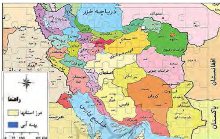
نقشه ۱: موقعیت مرزهای ایران

چالش‌های امنیت ملی در مرزهای ایران به‌ویژه در مرزهای ایران و ترکیه است. پرسش اصلی پرسش این است که اقتصاد مرزی چرا و چگونه بر چالش‌های امنیت ملی در مرزهای ایران به‌ویژه در مرزهای ایران و ترکیه تأثیرگذار است؟ این مقاله با استفاده از روش