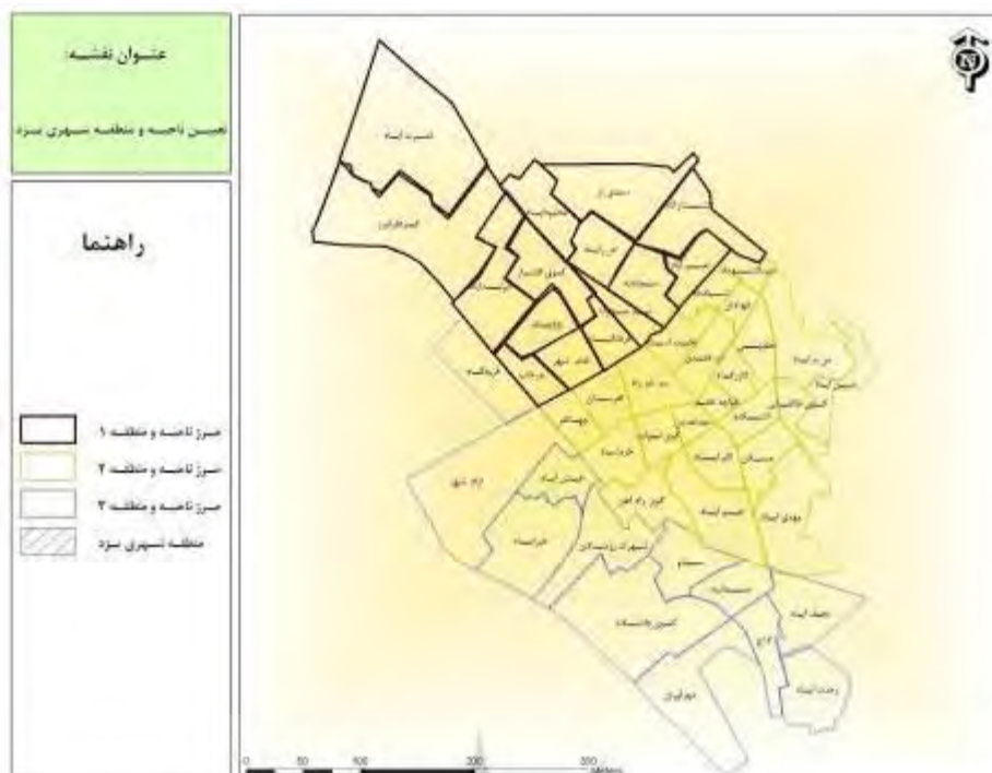
شکل ۱: مناطق شهری یزد