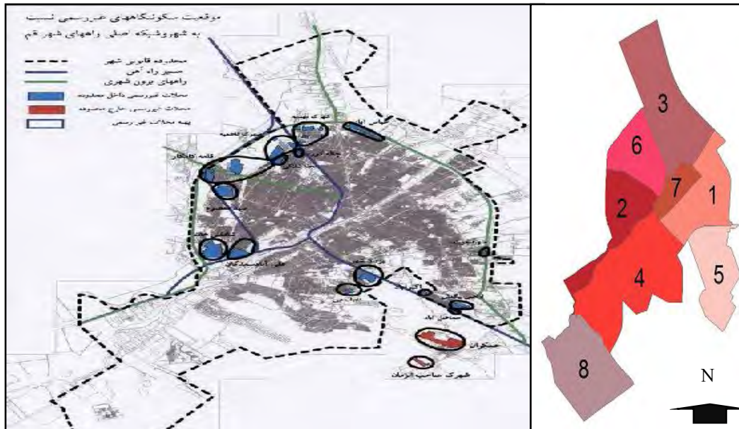
شکل ۲: موقعیت محلات فقیر و حاشیه‌نشین در میان مناطق هشت‌گانه کلان‌شهر قم مأخذ: (نگارندگان: ۱۳۹۶).

رگرسیون چند متغیره بهره گرفته شد. همچنین، براساس ماهیت تأثیر شاخص‌ها روی متغیر وابسته، فرض خطی بودن متغیرها در این تابع برقرار است. بنابراین، در این مقاله با استفاده از رگرسیون چند متغیره خطی و در نظر گرفتن عوامل استخراج‌شده از تحلیل عاملی اکتشافی به منزله متغیرهای مستقل، میزان تأثیر و ارتباط آن‌ها با متغیر وابسته یعنی سلامت اجتماعی شهروندان بررسی شده است.