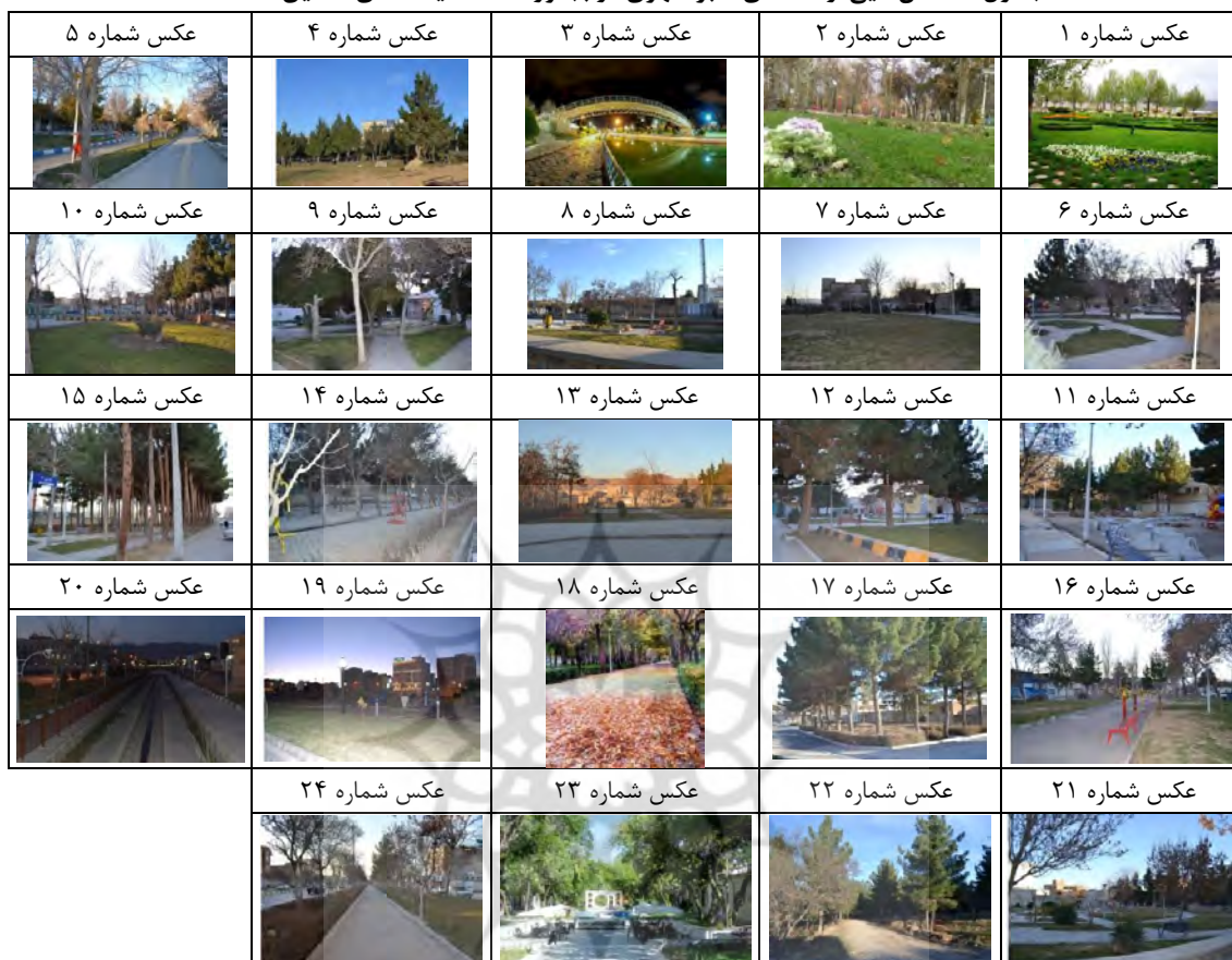
جدول ۴: عکس‌هایی از فضاهای سبز شهری در بجنورد

، زشت ۱- و خیلی زشت ۲- قرار گرفت و نتایج حاصل از این بررسی در جدول جداگانه‌ای تنظیم شد (Stenner, 2012; Watts Young, 2007). سپس به منظور محاسبه و جمع بندی امتیازات هر عکس از فرمول زیر استفاده شد: