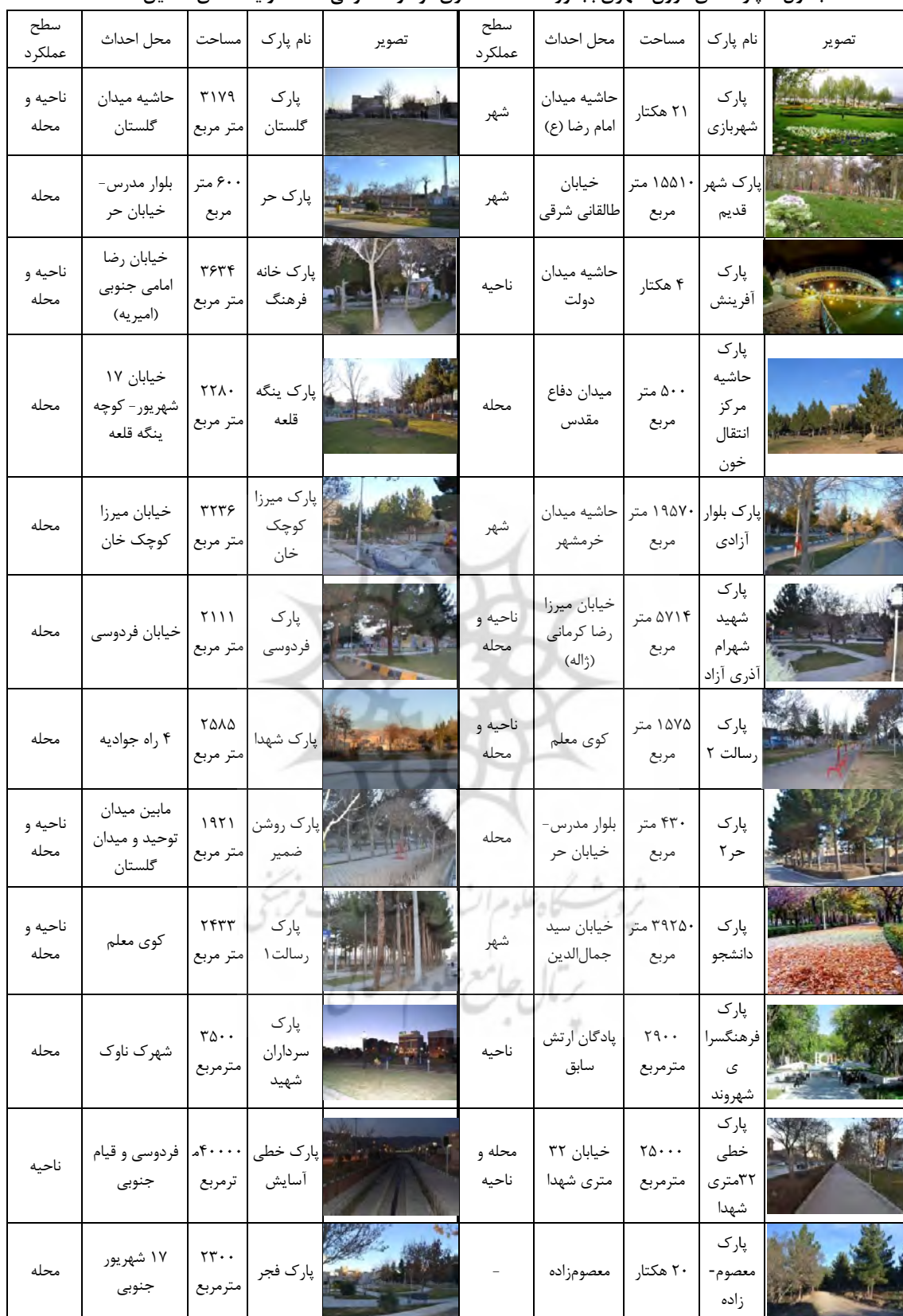
جدول ۳: پارک‌های درون شهری بجنورد، مأخذ: انصاری مود و معصومی، ۱۳۸۹ و یافته‌های تحقیق، ۱۳۹۵